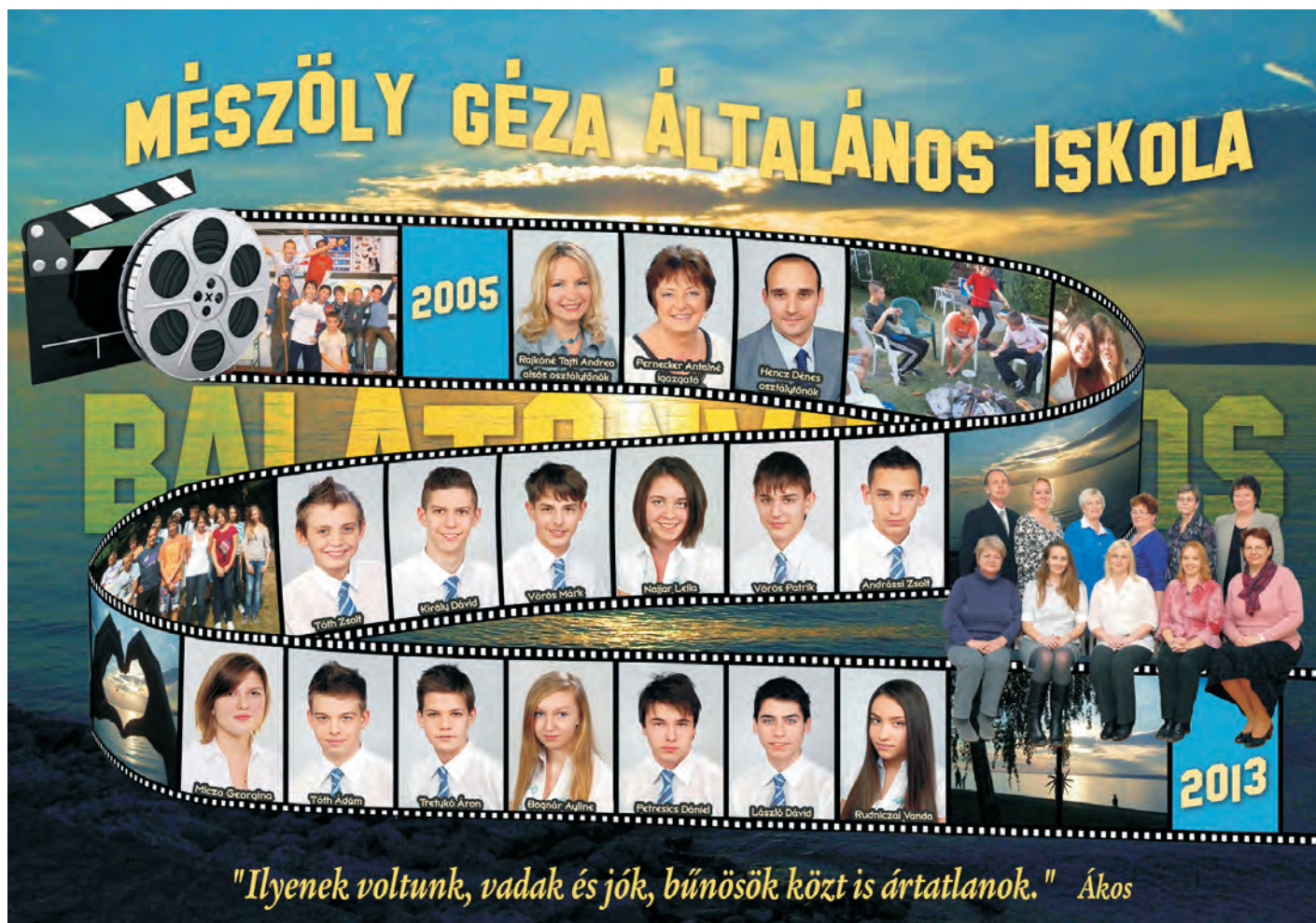
A ballagó 8.osztály tablója