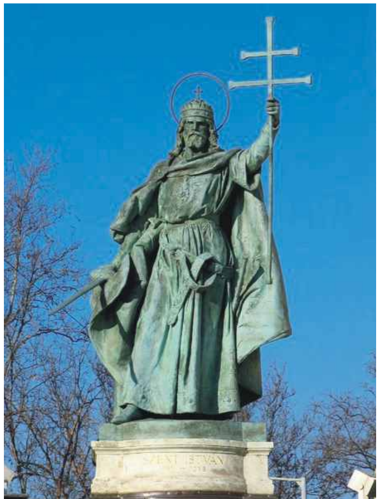
Szent István szobra a Hősök terén