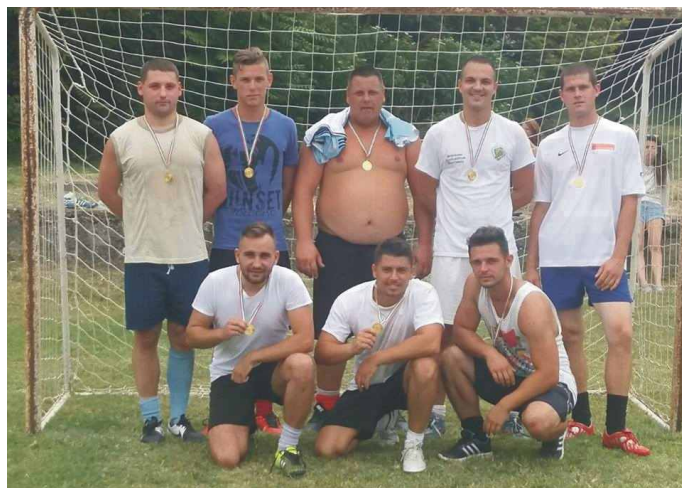
Falunapi bajnokság - Győztes csapat