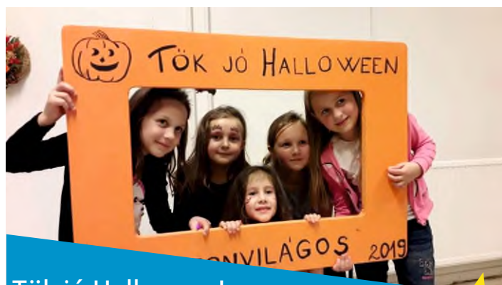
Tök jó Halloween!