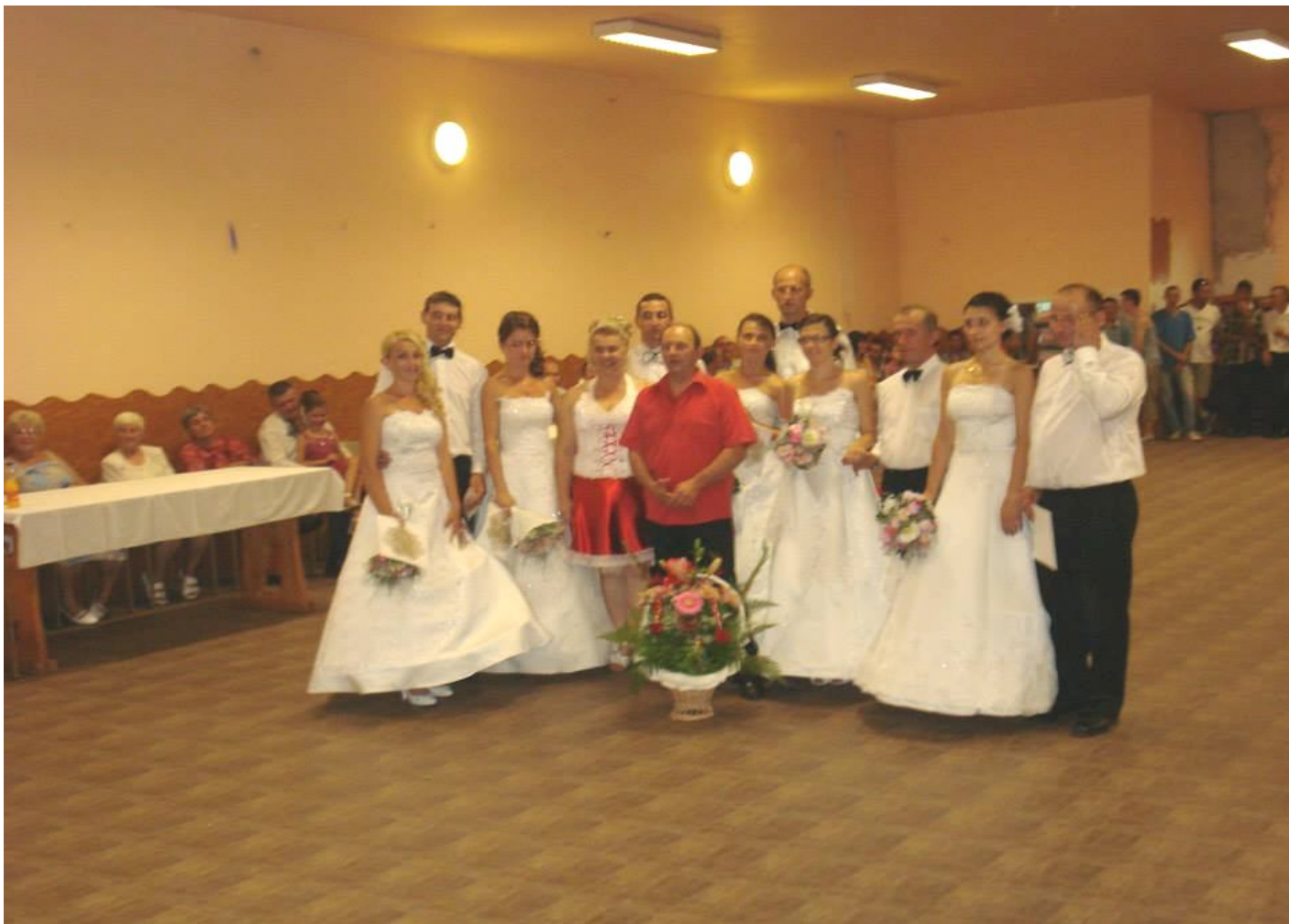
MENNYASSZONYI RUHA ÉS TÁRSASÁGITÁNC BEMUTATÓ