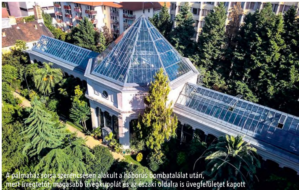
A pálmaház sorsa szerencsésen alakult a háborús bombatalálat után, mert üvegtetőt, magasabb üvegkupolát és az északi oldalra is üvegfelületet kapott

A 150 éves japánakác ( Sophora japonica ) az 1893-ban megnyílt Viktória-házról tudna mesélni. Ebben nő sok más trópusi vízi- és mocsári növény társaságában az amazonasi tündérrózsa, amelynek hatalmas levelei akár 50 kilogrammot is elbírnak. A levéltesztelő esemény napjainkban is nagy nép-