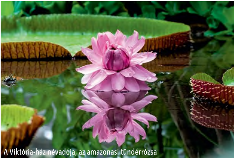
A Viktória-ház névadója, az amazonasi tündérrózsza

A famatuzsálemek által elmesélt történeteket bővíthetjük az élő kövületeknek nevezett növények több millió évre visszanyúló történetével. Ilyen élő kövület növényünk a sárkányfenyő ( Wollemia nobilis ). Létezésére csak 1994-ben derült fény Ausztráliában, addig csak 90 millió éves kövületekből ismerték. Az ilyen és ehhez hasonló növények rávilágítanak a botanikus kertek kiemelten fontos természetvédelmi feladatára, mely a veszélyeztetett, védett növények megőrzését, mesterséges elszaporítását, visszatelepítési kísérletek folytatását jelenti.