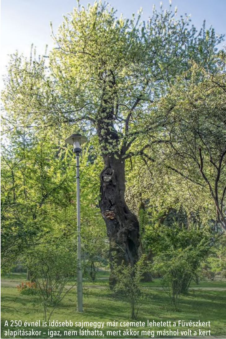
A 250 évnél is idősebb sajmeggy már csemete lehetett a Fűvészkert alapításakor – igaz, nem láthatta, mert akkor még máshol volt a kert