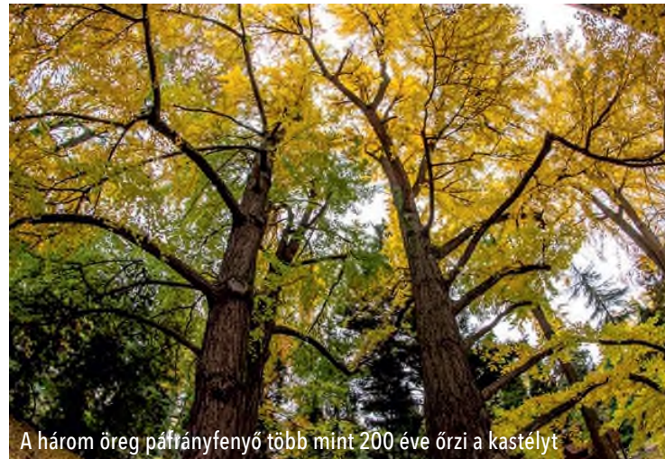
A három öreg páfrányfenyő több mint 200 éve őrzi a kastélyt

szerúségnek örvend. A csodálatos látványt nyújtó vízinövény 20-25 centiméter átmérőjű virága éjjel nyílik, az első éjszaka hófehér, a második éjjel pedig már kinyílás után rózsaszínre színeződik.