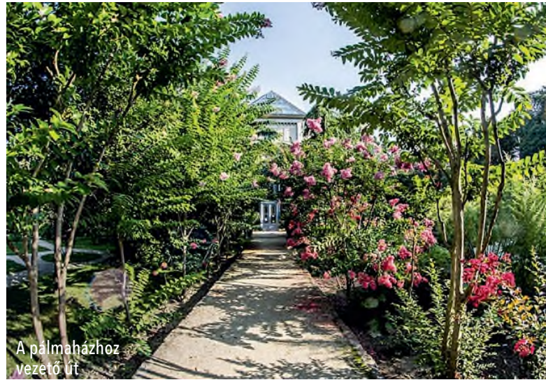
A pálmaházhoz vezető út