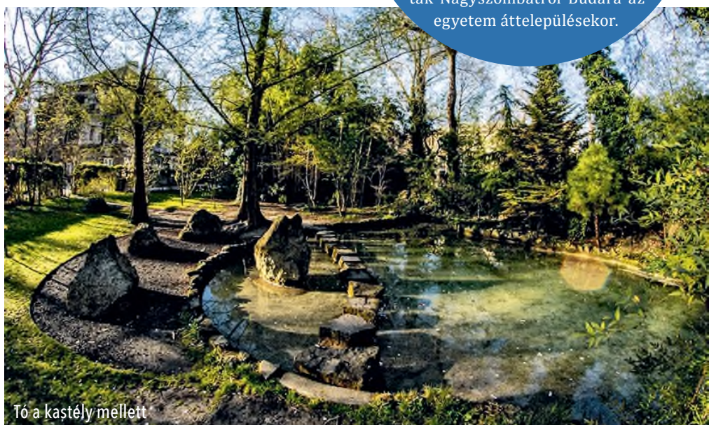
Tó a kastély mellett

A kastélyban most irodák, könyvtár, herbárium, és a magszoba található. Az emeleten az egykori lovagterem rendezvényhelyszínként működik, és kiállításoknak, koncerteknek, előadásoknak ad otthont. Falain még mindig jól láthatók a freskók nyomai. A Mária Terézia -korabeli régi szekrények is itt állnak, amelyeket állítólag tutajon szállítottak Nagyszombatról Budára az egyetem áttelepülésekor.