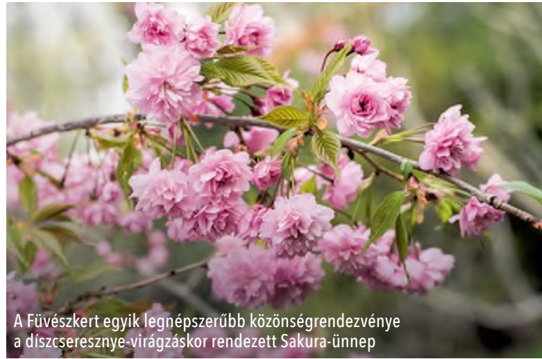
A Fűvészkert egyik legnépszerűbb közönségrendezvénye a díszcseresznye-virágzáskor rendezett Sakura-ünnep