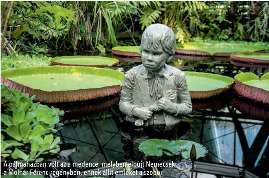
A pálmaházban volt az a medence, melyben elbújt Nemecek a Molnár Ferenc-regényben, ennek állít emléket a szobor

bolták a kertet, ezért egy újabb költözés mellett döntöttek.