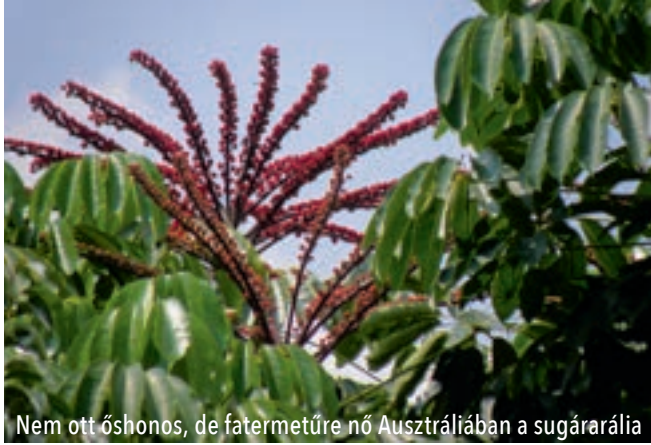
Nem ott őshonos, de fatermetűre nő Auszráliában a sugárarália