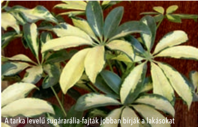
A tarka levelű sugárarália-fajták jobban bírják a lakásokat