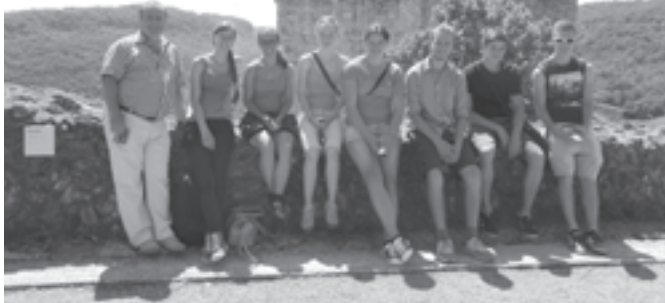
Castelnau várában a diákok egy csoportja