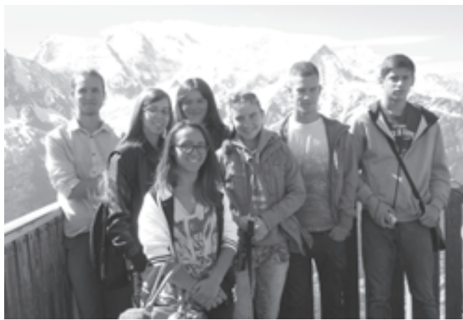
Háttérben a Mont Blanc hegycsúcsa

Másnap reggeltől kora délutánig a Svájc és Franciaország határán elhelyezkedő, nemcsak Európa, hanem a világ legnagyobb részecskefizikai laboratóriumába, az Európai Nukleáris Kutatási Szervezet (CERN) központjába pillanthatott be a társaság. Sajnos a kísérletekbe nem állt módunkban betekinteni, ugyanis egy pár évvel ezelőtt balul elsült munka kö-