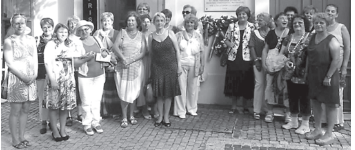
A Nők a Balatonért Egyesület Balatonfüredi Csoportja minden évben megemlékezik az első Anna-bál nagyszonyáról

Szüreti fesztivál és Szent Mihály-napi programok