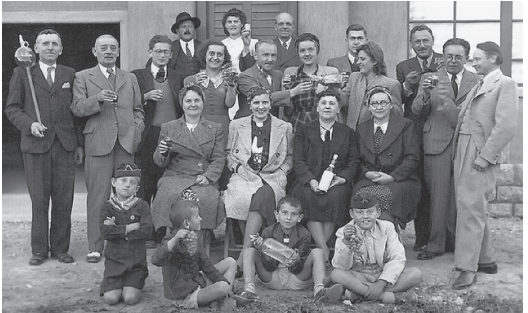
Vidám borívó társaság Balatonfüreden az 1930-as években

A borheteken ezúttal is három, előre be nem jelentett ellenőrzés lesz, valamennyi pincészet kínálatát többször vizsgálják. Egy minősítő bizottság végzi véletlenszerűen az ellenőrzést, valamennyi bort végigkóstolják, emel-