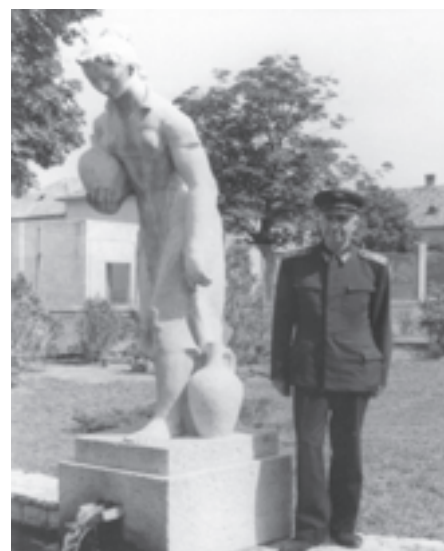
A szobor a vasútállomás parkjában

Madarassy (Machovits) Walter (Budapest, 1909. november 8.–Budapest, 1994. március 5.) szobrász- és éremművész, 14 éves kora óta készült hivatására. Iparrajziskolát, Iparművészeti Iskolát