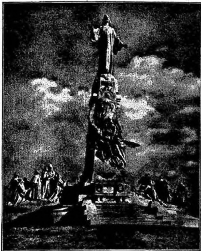
A spanyolországi csodálatosan elpusztíthatlan Szentszív szobor.

a munkahelyet, a templomot és kis kamráját ismerte. A munkaidőn kívül és kevés alvását leszámítva folyton imádkozott. Imája főleg elmélkedés és szemlélődés volt az Evangélium nyomán. Naponként elmondta az összes zsoltárokat és a rózsafüzért is. Leginkább az Oltáriszentség és a kereszt