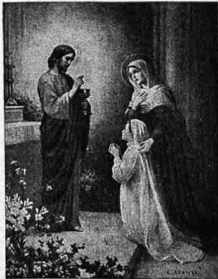
Ime az Isten báránya.