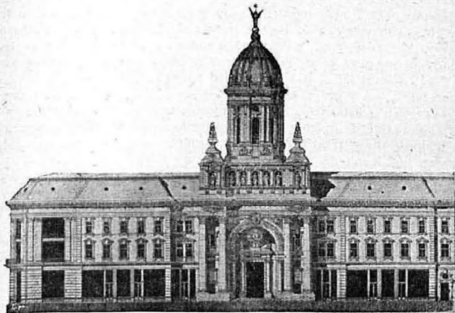
A minoriták temploma Aradon, hol minden évben október 6-án engesztelő szentmiseáldozatot mutatnak be az aradi vértanúkért, kik az Oltáriszentséget a börtön falai között buzgón magukhoz véve, bátran mentek a bítófa alá, hogy vért és életet áldozzanak a hazájukért.

villám csapott volna le mellettem, fölkiáltottam: «Nem mondtam el mindent!» Erre megindult könnyeimnek árja, lelkiatyám engem megölelt és én igazi szent örömmel dobtam ki magamból az öldöklő mérget, meggyóntam őszintén bűncimet; lelkiatyám pedig nagy örömben emelte föl ismét kezét, hogy reám hintse a feloldozás szava által a jó Isten kegyelmének égi harmatát. Erre én oly könnyűnek éreztem magamat, mintha csak egy nagy hegyet leemelték volna szívemről. Merem mondani, hogy én e naptól fogva lettem becsületes ember és éreztem