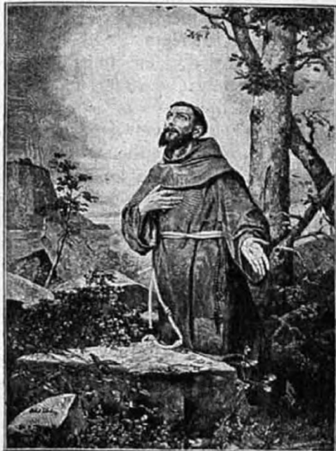
Szent Ferenc az Alverna hegyén imádkozik.

Tudnunk kell, hogy szent Ferenc bölcs — kisebb fokban minden hívő ember az, aki csak addig kutatja az okot, keresi az igazságot, míg józan eszének világossága, őszinte jóakarata ösztönzése, és tiszta szive sugallata szerint megtalálta és ha megtalálta örül neki, megállapodik benne, hogy érezze, éhezze, átélje azt. Ilyen bölcsnek azután könnyű volt behatni az istenségbe, mert nem annyira eszével, mint inkább szívével kereste azt: