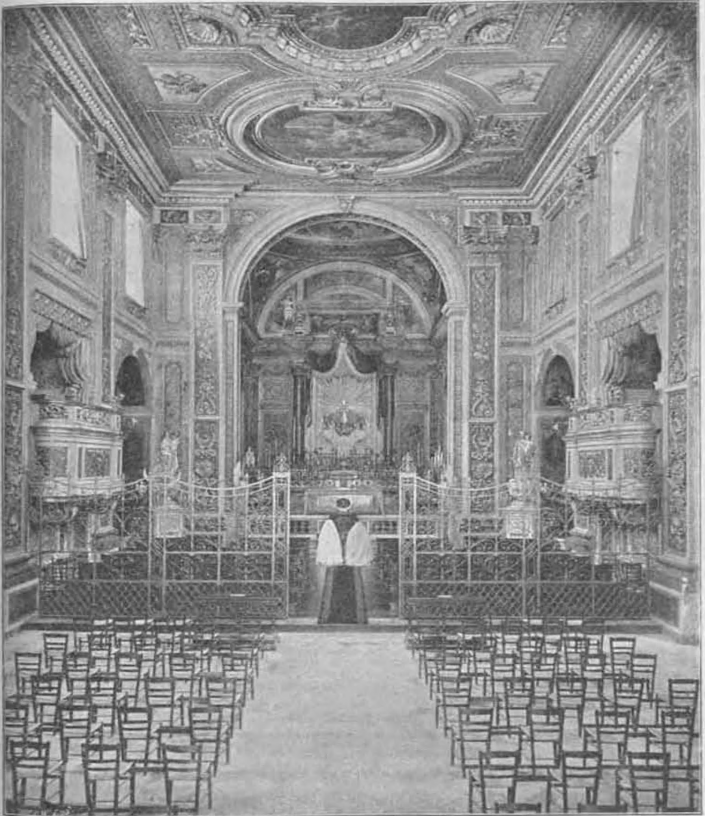
A romai örökimádási templom belseje.

vallási érzés nimbuszával veszi körül s így azt fölmagasztositva, mélyesgesebbé és állandóvá teszi s oly tartalmat kölcsönöz neki, mely azt a min-