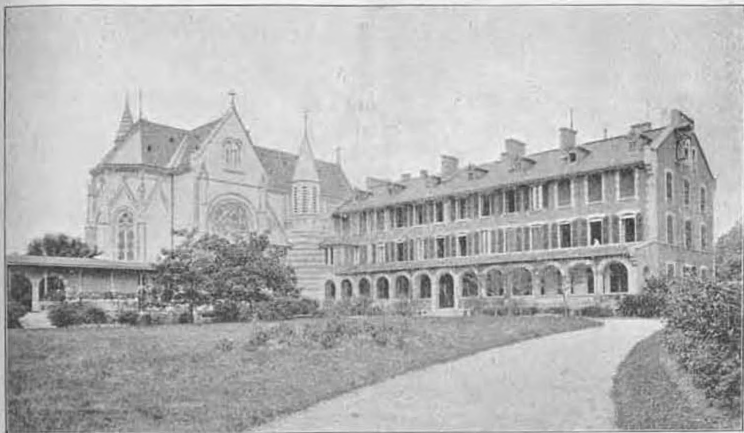
A Mária- Reparatrix apáczarend paui örökimádási temploma és zárdája.

«Őszinteség az áldozatban, a mely minden utógondolat nélkül mindent oda ad s a melyből azután a megnyugvás és a szivbeli vidámság származik».