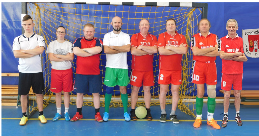
balról jobbra: 18, 28, 38, 43, 52, 63, 65, 61 évesek