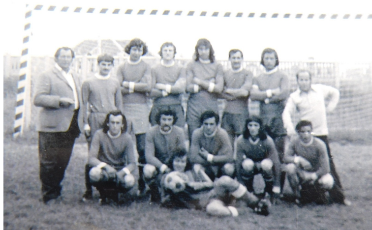
Sopronkövesd focicsapat 1975-ben: