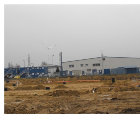
A bővülő Autoliv