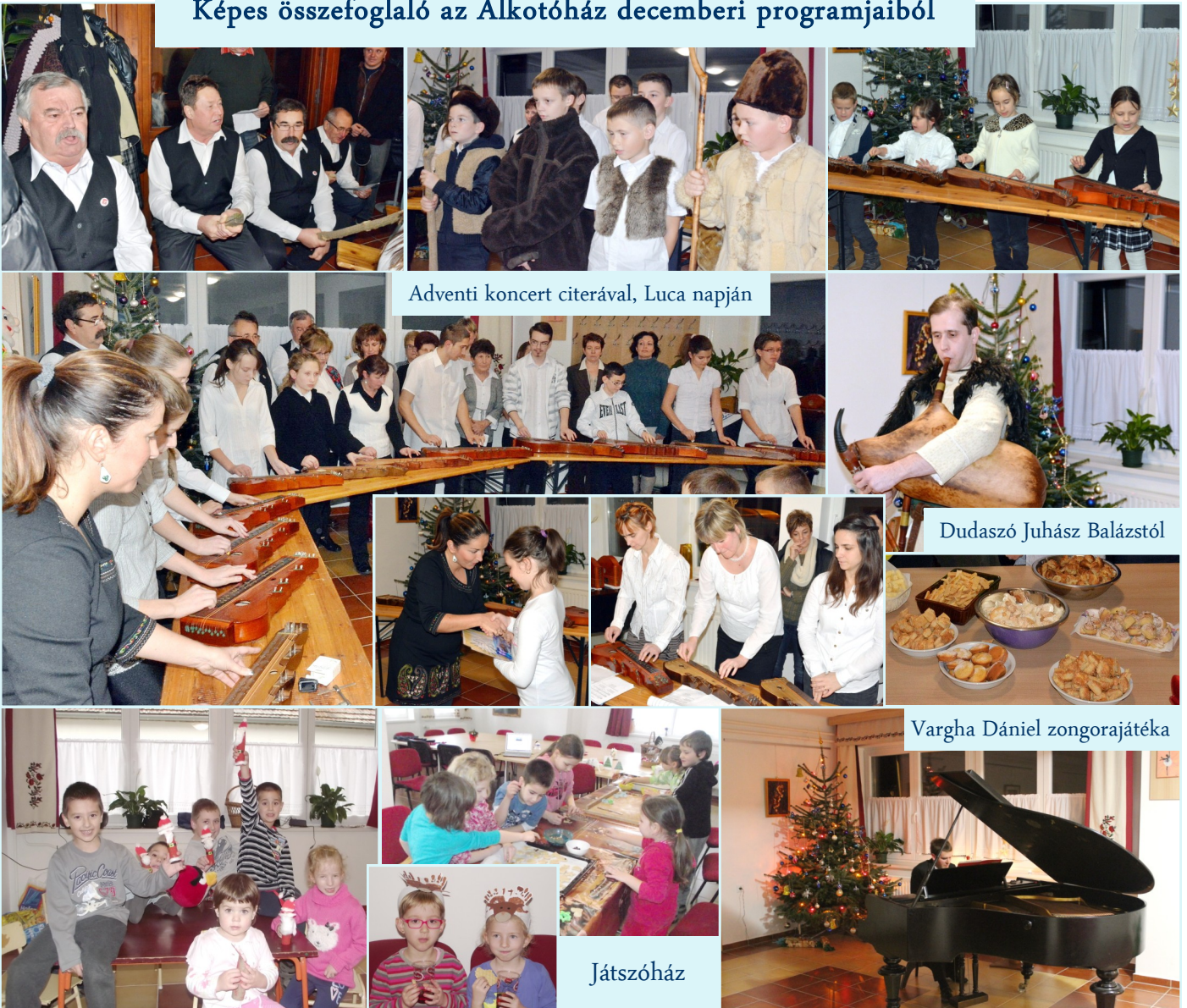
Adventi koncert citerával, Luca napján