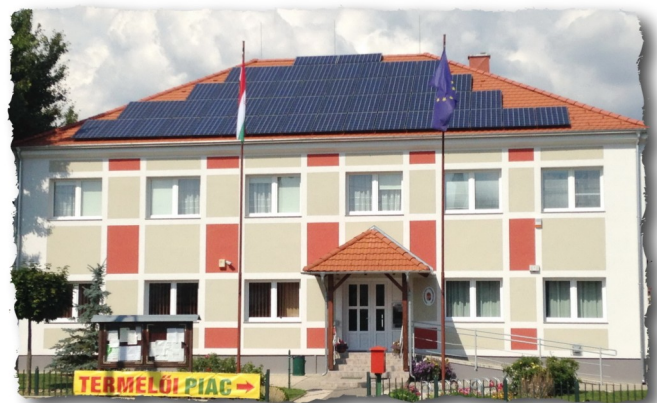
... ILYEN LETT