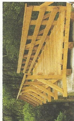
Kelmen David kutatása alapján

A közelben haladt egykor a mezőgazdasági célokat szolgáló keskeny nyomtávú lóvasút, melynek „élő” hírnöke az úgynevezett Cifra-híd. A hidat a vasút 1946-ot követő felszámolása után a korábbi sopronkövesdi bíró mentette meg a lebontástól.