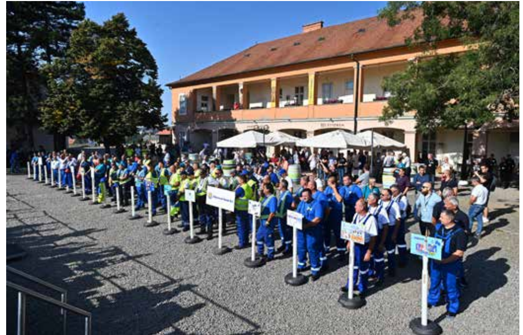
A csapatok a megnyitón