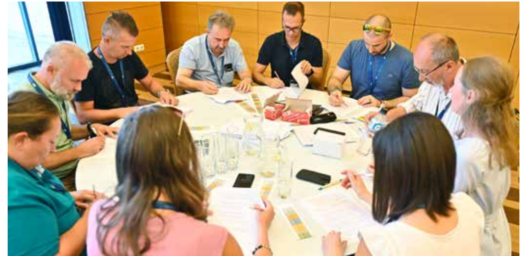
A zsűri javítja az elméleti feladatlapokat