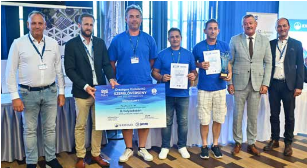
A II. helyezett a Mezőföldvíz Zrt. csapata lett