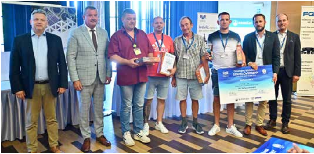
A III. helyezett a KAVÍZ Kft. csapata lett