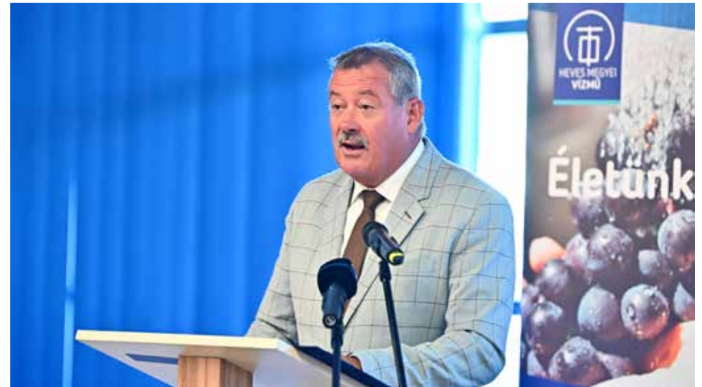
A díjátadón V. Németh Zsolt államtitkár mondott köszöntőt

lő elvezetésének, tisztításának. Az ő munkájuk nélkül az egész ország jövője kerülne veszélybe.” Az államtitkár kiemelte, hogy nagyra tartja, hogy a szolgáltatók napi feladataik mellett a szakma ünnepére delegálták kollégáikat, és vállalták a megméretést a legjobbak között.