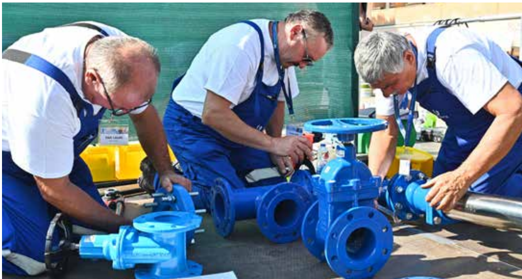
„Munka közben a versenyzők”

A rendezvény eredményhirdetésén beszédet mondott az Energiaügyi Minisztérium víziközmű-ágazatért felelős államtitkára, V. Németh Zsolt, aki kiemelte: „Az ágazatban dolgozó mintegy 20 ezer kolléga szakmai felkészültsége, elhivatottsága a záloga a biztonságos ivóvízellátásnak és a szennyvíz megfele-