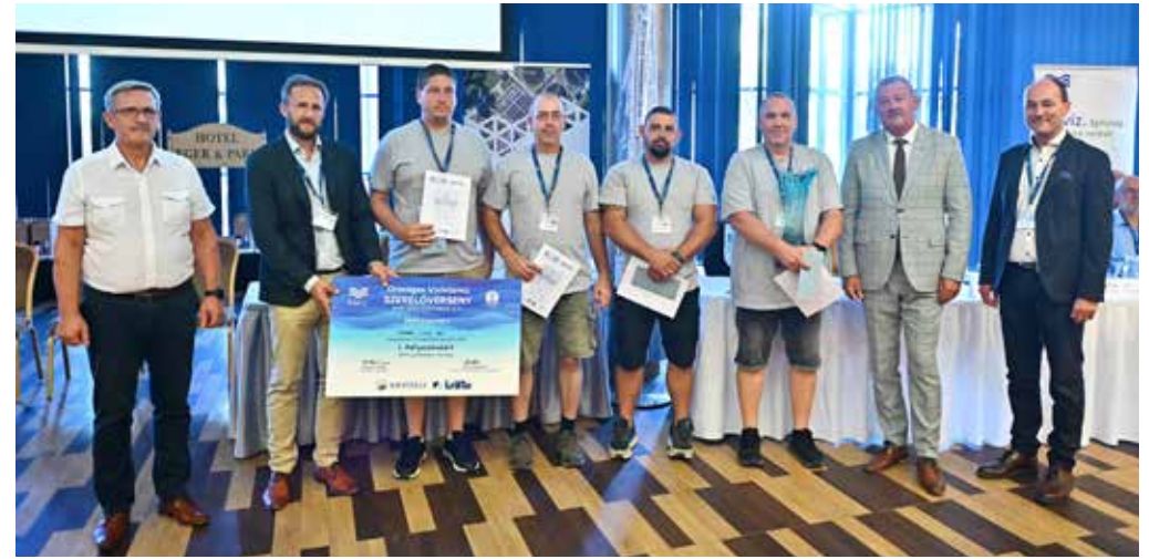
A győztes a Szegedi Vízmű Zrt. csapata lett