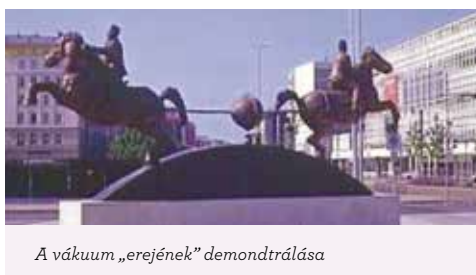
A vákuum „erejének” demonstrálása

hatalmas robajjal összeroppant. A leghíresebb kísérlete során – 1657-ben – a levegőt két összecsiszolt, egymásra helyezett féltekéből szívta ki, melyet 8-8 ló sem tudott széjjelszakítani. Amikor Guericke megnyitotta a csapot, a félgömbök szétestek. Amikor gömbök helyett hengert és dugattyút alkalmazott, észrevette, hogy a dugattyú a vákuum hatására munkát végezve elmozdul. Ez a megfigyelés válik később, 1712-ben a Newcomen-féle gőzgép alapjává.