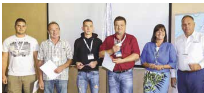
2. helyezett - Kaposvári Víz- és Csatornamű Kft.

M. B.: Köszönöm, és még egyszer gratulálók!