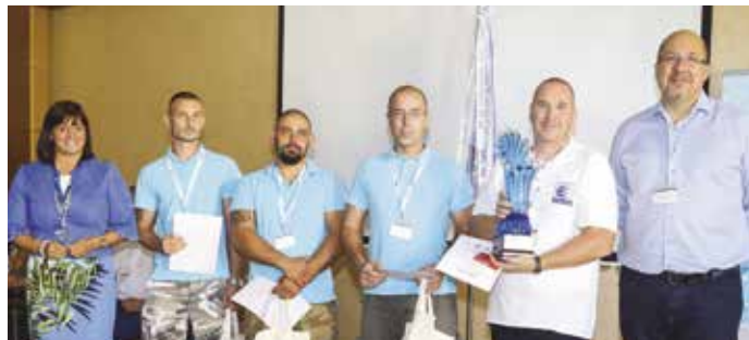
1. helyezett - Szegedi Vízmű Zrt.

Gy. Cs.: Jó sok papírral... Kaptunk olvasnivalókat, tesztek, ezeket