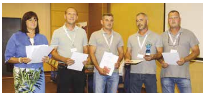
3. helyezett - Tiszamenti Regionális Vízművek Zrt.