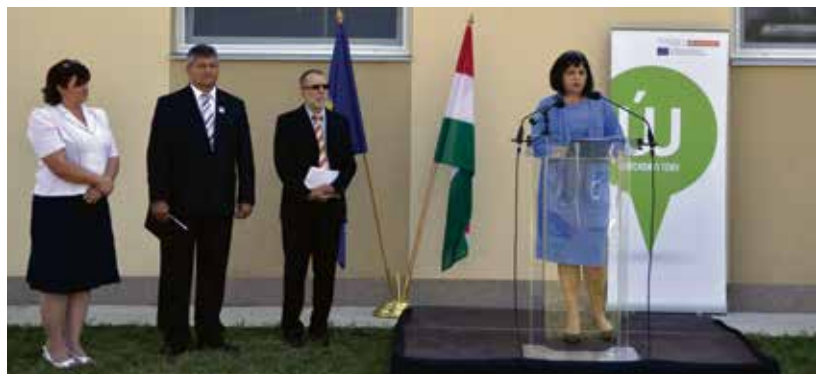
A felújított kiskorei vízmű átadásán Hegmanné Nemes Sára, a Nemzeti Fejlesztési Minisztérium vagyoni politikáért felelős államtitkára mondott ünnepi beszédet

A nagy változások a rengeteg pozitívum mellett sok kihívással és nehézséggel is járnak, amelyekkel meg kell küzdeniük a TRV Zrt. dolgozóinak. Az integrált települések nagy részén a vezetékek elavultak és nem megfelelő műszaki állapotúak. Ezért végre kell hajtaniuk a megfelelő ivóvíz- és szennyvízellátás biztosításához szükséges technológiai karbantartásokat és felújításokat. Az erre befektetett összeg középtávon, legalább tizenöt éves működtetés esetén térül meg. Ugyanakkor a folyamatos fejlődést és fejlesztést segíti területünkön az ivóvíz- és szennyvízellátás minőségét javító, jelenleg is futó, összesen hetvenegy pályázatunk, melyek megvalósulásával jelentősen nő az ellátás biztonsága. Ezzel párhuzamosan a hatékonyabb működést célozza a számítástechnikai, számviteli és bérprogramok terén elindított karbantartásunk, valamint egy nagyobb, egybefüggő rendszer kialakítása, illetve egy összehangolt irányítás-vezérléstechnikai rendszer kiépítése és a szervezeti egységek összehangolása is.