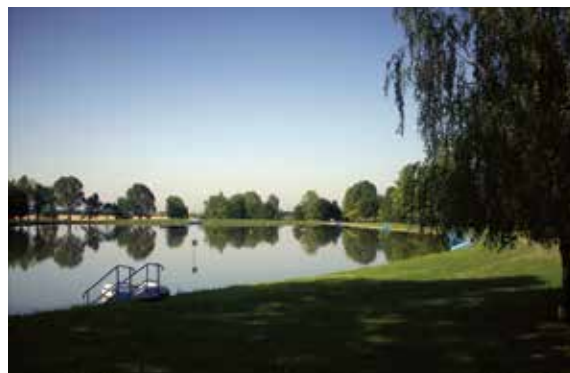
Árnyas ligetek és kiváló vízminőség várja a strandolókat a Tőfűrdőn

Hosszú távú céljaink között szerepel, hogy a Tiszamenti Regionális Vízművek Zrt. – Közép- és Északkelet-Magyarország térségének meghatározó víziközmű-szolgáltatójaként – tagja legyen annak a kis létszámú szolgáltatói körnek, akik biztonsággal nyújtanak magas színvonalú ivóvíz- és szennyvíz-, valamint mezőgazdaságivíz-szolgáltatást az érintett területeken.