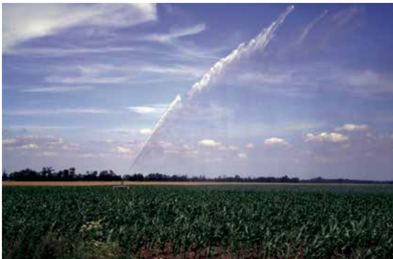
A TRV Zrt. egyik jelentős szolgáltatása a mezőgazdasági öntözővíz biztosítása

A TRV Zrt. a szolnoki, Thököly úti telephelyén található szivattyúszervize végzi a Grundfos cég teljes termékskáláját felvonultató szivattyúk és tartozékok teljes körű garanciális és garancián túli javítását, szervizelését és az új szivattyúk értékesítését. Az általuk nyújtott szolgáltatások között szerepel emellett szakmai szaktanácsadás, valamint lakossági és ipari szivattyúk karbantartása is.