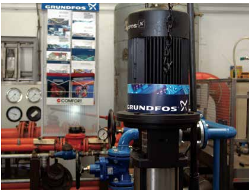
Központi elhelyezkedésének köszönhetően Szolnokon található Kelet-Magyarország legjelentősebb, állami vízszolgáltató által működtetett ivóvízszivattyú-szervize

Büszkeségünk még a Debrecenhez közel fekvő Látóképi strandfürdő, a környékbeliek egyik legkedveltebb szabadtéri fürdőhelye, amelyet szintén társaságunk üzemeltet. A strandfürdőhöz szükséges vizet a Keleti-főcsatornából biztosítjuk, ezért nem meglepő, hogy az általunk fenntartott létesítmény a rendeletben meghatározott kategóriák közül a legmagasabb, „kiváló minőségű” minősítést kapta az elmúlt évek során minden alkalommal.