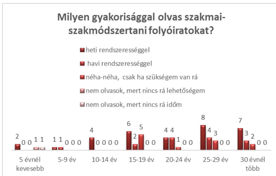
2. ábra: A szakfolyóiratok iránti érdeklődés és a pályán eltöltött idő összefüggései

A megkérdezettek több mint fele (54%-a) nyilatkozott úgy, hogy heti rendszerességgel olvas szakfolyóiratot. A válaszolók 24 %-a havonta, 19% pedig ritkábban, csak szükség esetén lapozza fel a folyóiratokat. Két válaszadó volt, aki eltérő okból ugyan, de nem olvas szakmai lapokat.