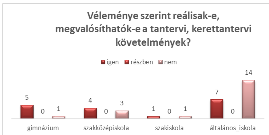
5. ábra: A megvalósíthatóság megítélése iskolatípusok szerint

Nagyobb a különbség a megítélésben, ha az iskolatípusok szerinti megoszlást nézzük. A gimnáziumban és a szakközépiskolában tanítók esetében többségben vannak azok, akik teljesíthetőnek tartják a követelményeket. Különösen igaz ez a gimnáziumban oktatókra esetében (5. ábra). Az általános iskolai tanárok közül ugyanakkor a megkérdezettek kétharmada gondolja úgy, hogy nem teljesíthetők az elvárások.