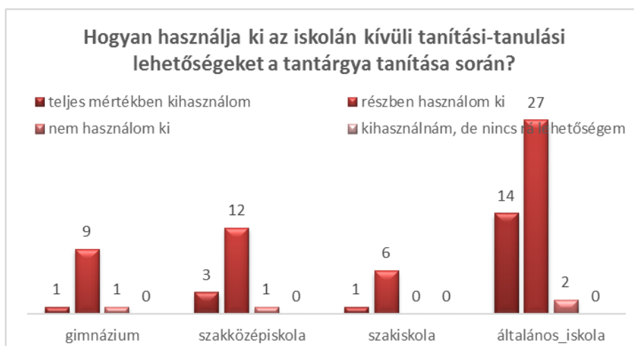
4. ábra: A tanórán kívüli lehetőségek kihasználásának megoszlása iskolatípusok szerint.

A tanórán kívüli tevékenységekben valamivel aktívabbnak tűnnek a fiatalabb korosztályba tartozó, pályakezdő kollégák. Ennek oka kereshető a tanárképzés megújulásában, az új tanulás-tanításszervezési módszerek ismeretében, de a fiatalabb életkorból adódó rugalmasabb időbeosztásban, aktivitásban is. A minta kis száma miatt azonban mélyebb következtetések nem vonhatók le az adatokból.