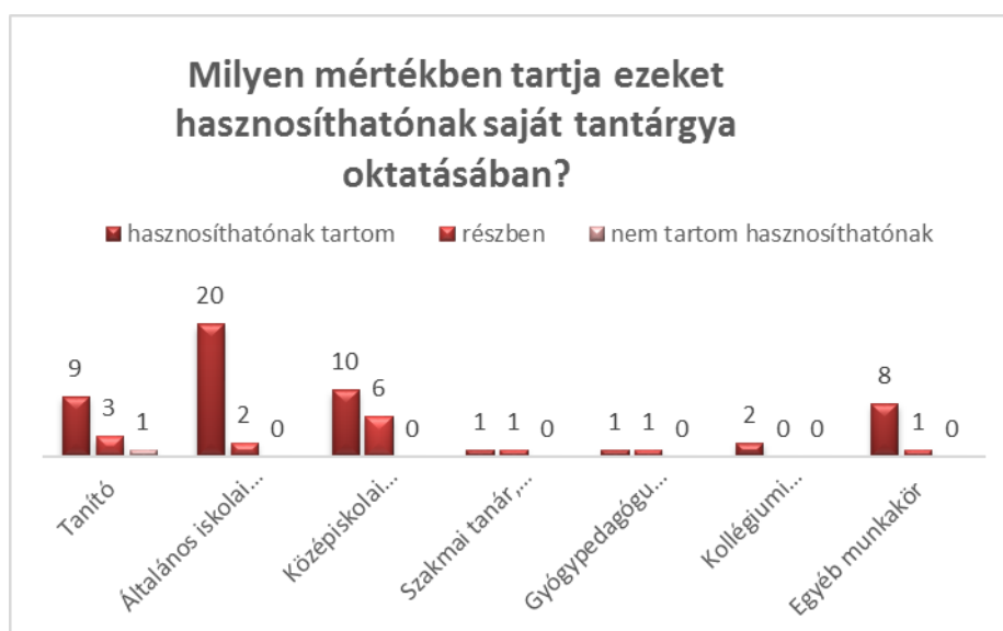
3. ábra: Az olvasottak hasznosíthatóságának megítélése tanári képzettség szerint

A pályán eltöltött idő alapvetően nem befolyásolja a szakfolyóiratokban leírtakkal kapcsolatos vélekedést. Árnyaltabbá válik ugyanakkor a kép, ha a tanárok szakképzettségével vetjük össze a felhasználási hajlandóságot (3. ábra). Megállapítható, hogy az általános iskolai tanárok tartják leginkább hasznosíthatónak a szakmai újdonságokat. Az ő esetükben ez a megkérdezettek 91%-át jelenti. A tanítók esetében ez 70%, míg a középiskolai tanárok között már csak 62%. Ez az arány egybeesik azzal a tapasztalattal, hogy a szakmódszertani jellegű szakmai továbbképzéseken legnagyobb számban az általános iskolai tanárok vesznek részt, legkevésbé pedig a középiskolában tanítók kapcsolódnak be ezekbe a képzésekbe.