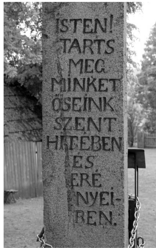
A Salvator-kápolna előtti kereszt felirata

Zarándokutunk utolsó állomása Alsó-csernáton volt, ahol a falu egyik szép udvarházában működik a Haszmann Pál Néprajzi Múzeum, Erdély egyik leggazdagabb, legszebb magyar népművészeti gyűjteménye. A múzeumi anyag Felső-Háromszék népművészetének legértékesebb darabjait mutatja be. A két éve elhunyt múzeumalapító, Haszmann Pál valóban egy nemzetben gondolkodó és az egész magyarság sorsát szívében viselő nagyszerű néprajztudós volt,