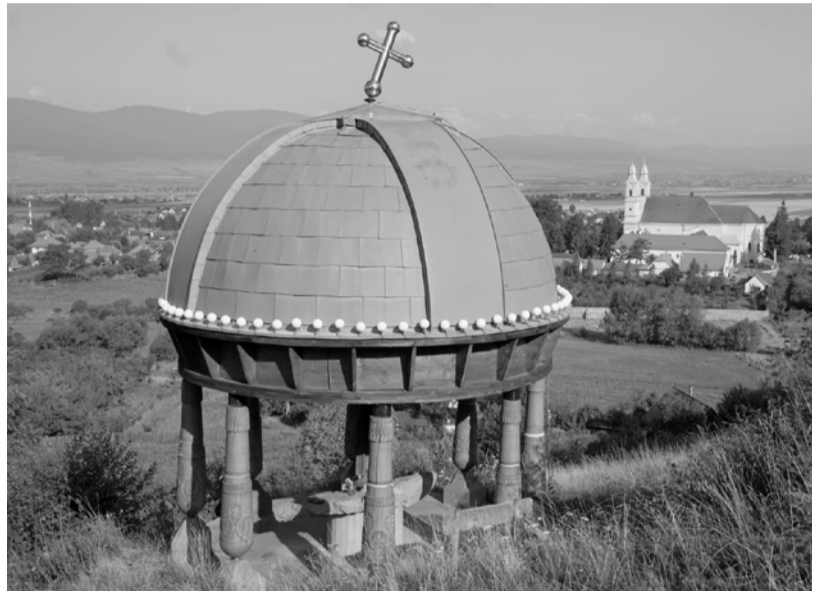
A Szent Korona-kápolna a Kissomlyó-hegyén

Vargyas épített öröksége a Daniel-kastély. A Daniel család tagjai hosszú évszázadokon keresztül fontos szerepet töltek