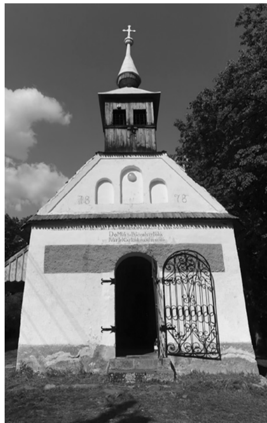
A csiksomlyói Salvator-kápolna

Szemközt a Nagyküküllő jobb partján jellegzetes alakú kopár sziklaorom neve Budvár dombja. A székely nép emlékezete Budvart a hun mondával hozza kapcsolatba, amely szerint Attila testvére, Budva építette és tartózkodott benne. A vár és a kápolna regényes múltjára több rege is emlékezik. Az egyik szerint a kápolna helyén pogány áldozati hely állott, míg szemközt a várban már keresztény vitézek voltak. Egy alkalommal, amikor látták a pogány áldozati szertartást, a leghíresebb íjász Jézust kiáltva nyilat repített közéjük. A pogányok ijedtségben szintén Jézust kiáltva megtértek. A csodás esemény emlékére építették a kápolnát.