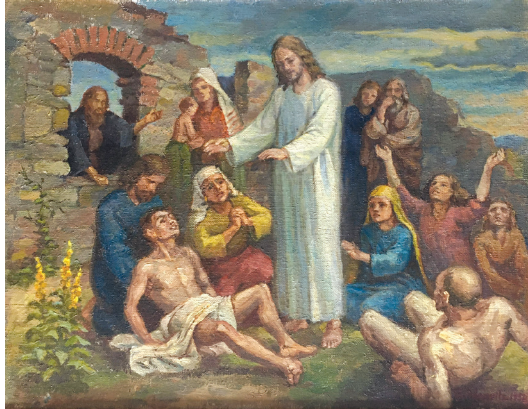
Lukácsovits Magda: Jézus gyógyít, 1953, olaj/vászon, 65x50 cm, magántulajdonban

A mustárvirág megjelenítése, illetve ennek a figyelemfelkeltő mustársárga színnek a többszörös használata világítja meg és szintetizálja a kompozíció lényeges mondanivalóját: a hit ereje csodákra képes. Jézus földi élete során megannyiszor hangsúlyozta a hit fontosságát mint az örök élet egyik alappilléret. Az igazi hit gyógyít, szabadá tesz, és olyan láthatatlan kapukat tár fel,