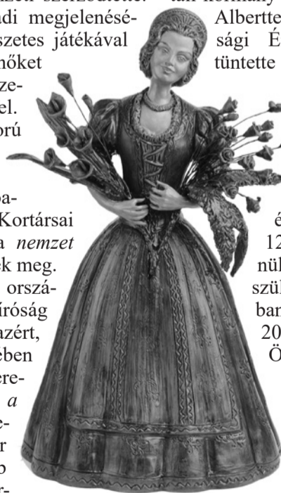
Józsa Judit alkotása