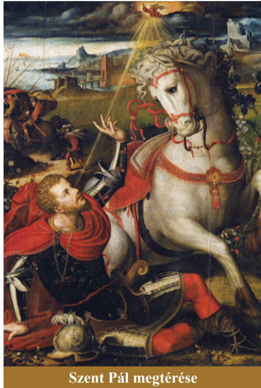
Szent Pál megtérése

Ferenc pápa az ortodox küldöttség előtt az olajfa hasonlatából kiindulva a közös gyökerekről beszélt, amelyek az Evangéliumból nőtték ki magukat, majd bocsánatot kért Istentől és a testvérektől a megosztottságért és az elkövetett hibákért a katolikusok részéről. Viszont a gyökerek apostoli