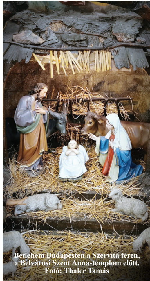
Bélem Budapesten a Szervita téren, a Belsővárosi Szent Anna-templom előtt.

Pásztorok tanyáztak a vidéken, kint a szabad ég alatt, és éjnek idején őrizték nyájukat. Egyszerre csak ott állt előttük az Úr anyaga, és beragyogta őket az Úr dicsősége. Nagyon megijedtek. De az angyal így szólt hozzájuk: „Ne féljétek! Íme, nagy örömet adok tudtul nektek és az lesz majd az