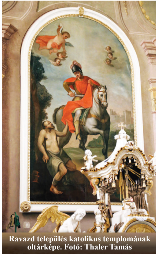
Ravasz település katolikus templomának oltárképe.

Róma, Lateráni Szent János, 2021. szeptember 28.