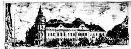
A szentési városháza

Ezért hozom boldogan a külföldön élő testvérek tudomására is, hogy van a mi kis hazánkban egy olyan város, melynek lakossága és vezetősége képes volt észrevenni a keresztény egyházak látható egységének ösztársadalmi jelentőségét, és