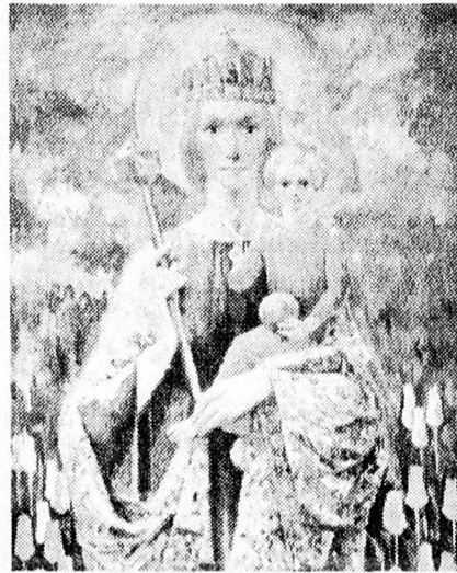
Boldogasszony Anyánk Feszty Mása festménye

szent és egyetemes anyának, a római egyháznak, mely alattvalót nem tekint szolgának, hanem fiainak tartja.” István király megszervezte a közigazgatást, a vármegyéket, valamint az egyházmegyéket, és gondja volt mindenkire. Levelezésben állt kora leghíresebb benecés apátjával, a cluny Odilóval, akin keresztül francia misszionáriusokat