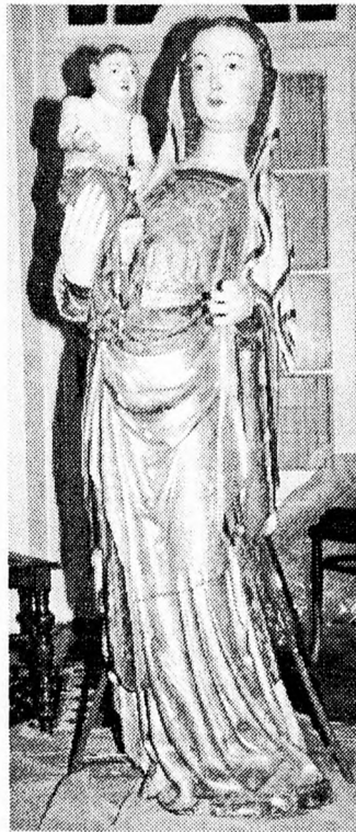
A restaurált Erdélyi Madonna-szobor

Sajnos, az érsekség minden hivatalos próbálkozása, levelezés útján, sikertelennek mutatkozott, mert a tordatúriak ragaszkodtak tulajdonukhoz.