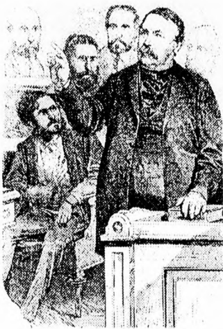
A képviselőház padsoraiból. A Deák-párt. Elöl Deák Ferenc beszél, mellette balra ül Andrássy Gyula gróf, mögötte Bittó István, tovább jobbra Kovács László, Kautz Gyula és Bezerédy László

Az 1860-as évek vége felé történt. Egy este Deák Ferenc a szabadelvű klubból hazafelé indulva kereste a kalapját az akasztón. Nem találta. Amint keresi,