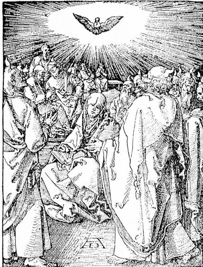
A SZENTLÉLEK ELJÖVETELE

Ha a Szentlélek vízzel nem öntöztetik a mi lelkünk, olyan, mint a föld eső nélkül; önála nélkül semmi zöltség és szépség, semmi haszonra való és vétek nélkül.