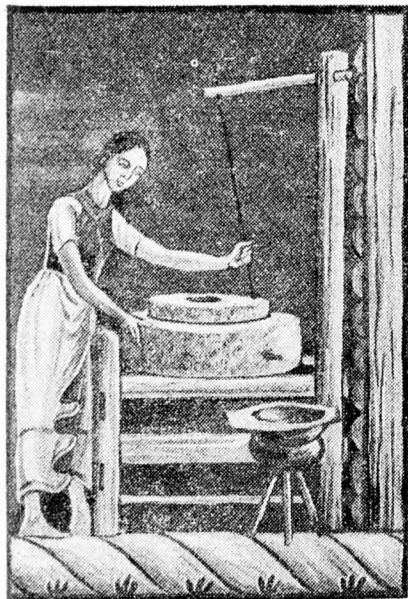
A MAGYAROK SZIMFÓNIAJA

Régi kép alapján készült rajz (Néprajzi Múzeum, Budapest)