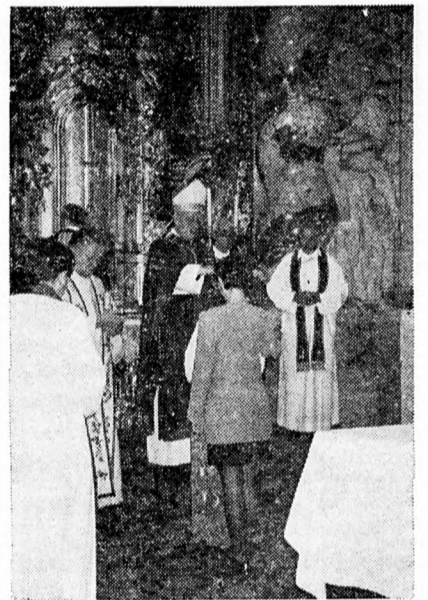
BÉRMÁLÁS MÜNCHENBEN A DAMENSTIFT TEMPLOMBAN