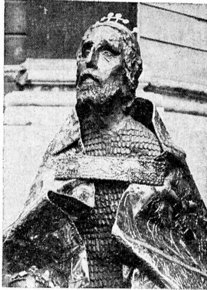
SZENT ISTVÁN KIRÁLY AACHENI SZOBRA

tartottak bennünket. Szeretném hinni, hogy Európával, jelesül Németországgal való kapcsolat, a sokat emlegetett szerepünk annak az egy téglának a kiemelése a Berliini Falból, végleg megadja