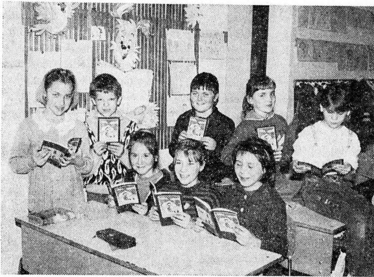
A gyerekek egy csoportja a kapott Bibliával.