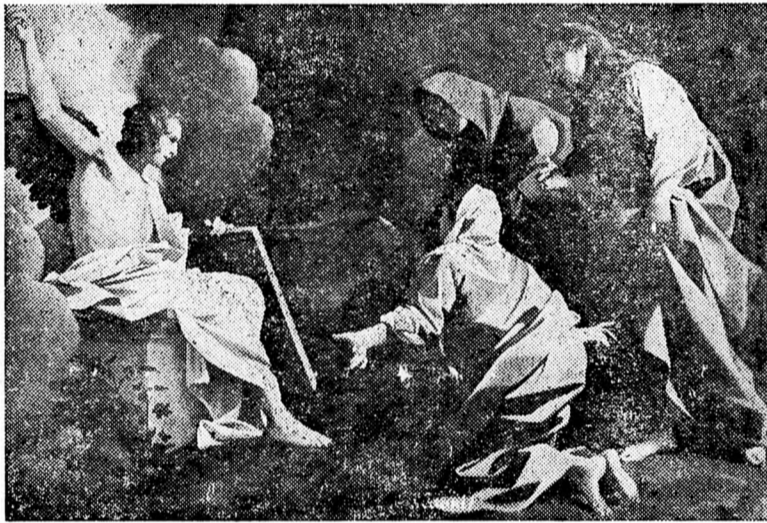
NINCS ITT, FÖLTÁMADOTT!

lent, mint kibontakoztatni az egészséges családi életet, elősegíteni egy szilárd, erkölcsi alapokon álló fiatal nemzedék kinevelődését és távol tartani tőle minden romboló, dekadens befolyást, amely fiataljainkat a szabadság cégére alatt rabokká, az érzékek és ösztönök rabjaivá teszi. A feltámadással a magyarságnak az életet kell választania, amiből logikusan következik, hogy fel kell vennie a küzdelmet a halállal — a lelki, az erkölcsi halállal éppúgy, mint az öngyilkos nemzethalállal, amely népünket évek óta