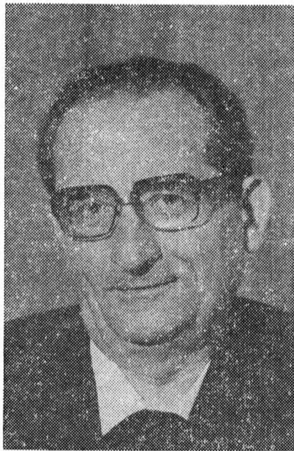
1919 FÁBÍÁN KÁROLY 1993

Hivatására a Collegium Germanicum et Hungaricum falai között készült, ebben a nagyműltű, sok kiváló egyházi személyiséget nevelő római intézetben. 1947-ben szentelték pappá Rómában. Amikor már nyilvánvaló volt, hogy nem térhet visz-