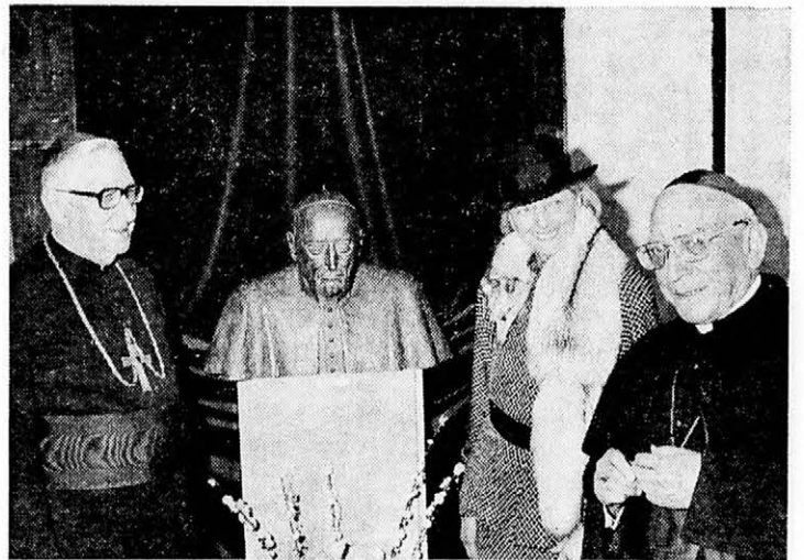
A képen balról jobbra: Paskai bíboros érsek, a szobor a művésznővel és Casaroli bíboros vatikáni államtitkár

Ez teljesen véletlen volt. Előtte fejeztem be a férjem portréját. Ez idő tájt volt nálunk egy ismerős, aki néhány fényképet mutatott egy szép, de ismeretlen szoborról. Kérdésemre, hogy kit ábrázol a mű, meglepő választ kaptam, miszerint az általam jól ismert Mindszenty bíborost. Amikor vendégünk távozott, mondtam a férjemnek, megpróbálom élethűen megmintázni — ahogyan én megismertem — a hercegprímást.