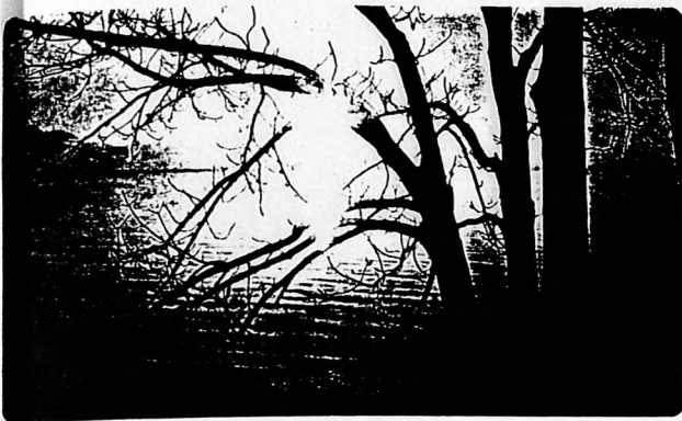
...és bocsásd meg a mi vétkeinket, miképpen mi is megbocsátunk az ellenünk vétkezőknek! Máté 6,12

A BÉCSI MAGYAR LELKÉSZSÉG melléklete az "ÉLETÜNK" - höz 1 9 9 0 február