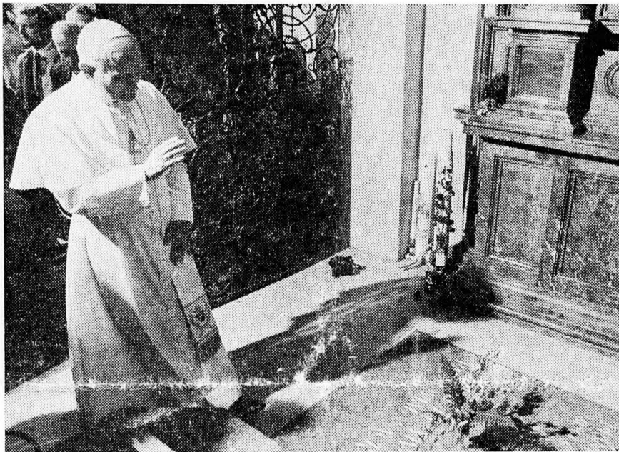
II. JÁNOS PÁL PÁPA MEGÁLDJA A MINDSZENTY-SÍRT (1983. szept. 13.)

Ez a szentmise tulajdonképpen a németajkúak megemlékezése volt Mindszentyről. A szentbeszédet a gráci spirituális mondotta. Utalt Mindszenty végrendeletére, amelyben meghagyja