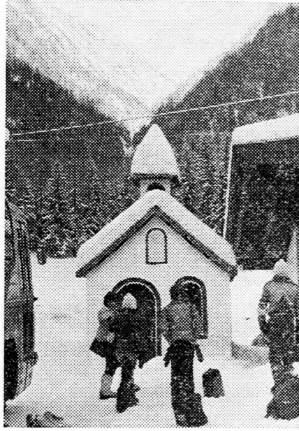
Kis kápolnacska Szentjakabfalván, amelytől a „Hotel Kapellenhof” a nevét kapta

A „Misinatető” nevet viselő 1980/81-es téli cserkész-tábor, amely dec. 26-tól jan. 6-ig tartott — ezúttal is, mint már hosszú évek óta a Dél-tiroli Szent Jakabfalván — piros betűkkel kerül feljegyzésre az Európai Cserkészkerület történetében. Ugyanis a téli táborok sorában ez volt a büszke tizedik! Tehát jubiláltunk!