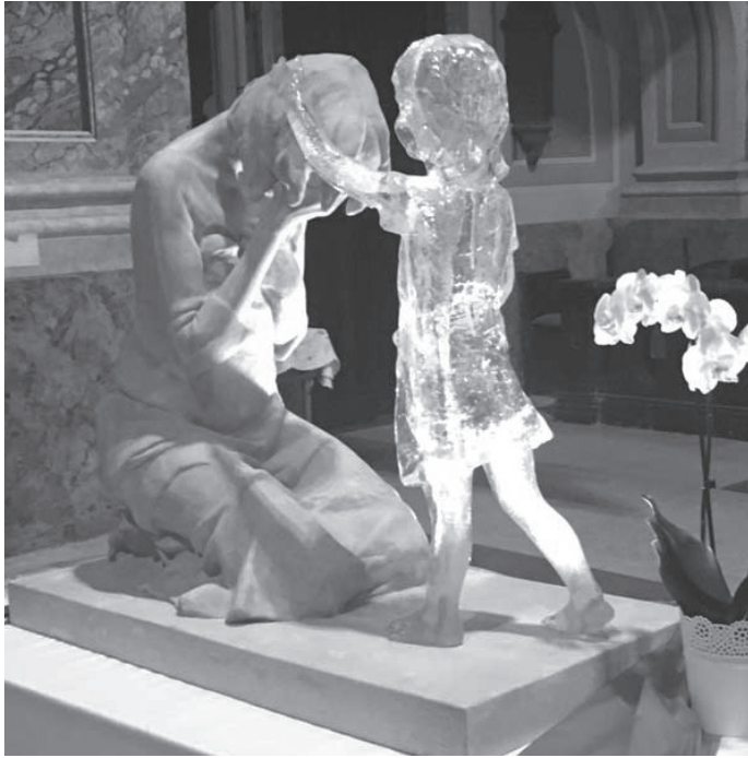
A „Meg nem született gyermek” vándorszobra Martin Hudacek alkotása

Az év utolsó napjaiban több ünnepünk is a gyermekek, a család felé irányítja a figyelmünket. Egyik legfontosabb a karácsony, amikor mi, keresztények azt ünnepeljük, hogy Megváltónk közénk jött és kisgyermek képében megszületett erre a földi világra. De emellett örömmel tölt el minket, hogy ezekben a napokban együtt van az egész (nagy)család, kedves ajándékokkal lepjük meg egymást, és