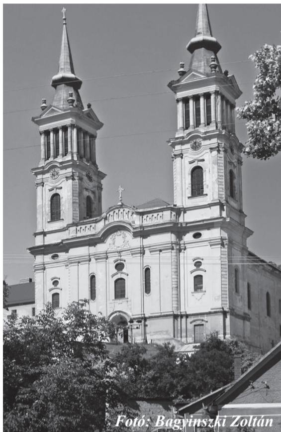
Fotó: Bagyinszki Zoltán

(Forrás: romkat.ro Szerkesztette: Horváth Enikő)