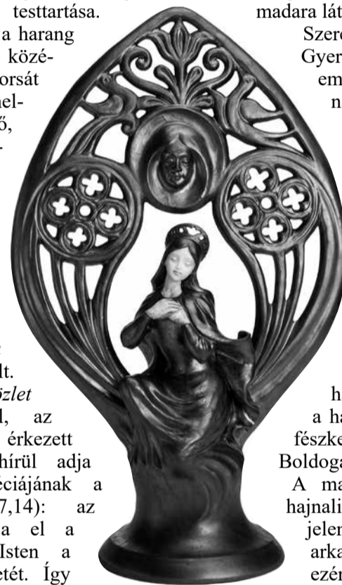
Józsa Judit: Gyümölcsoltó Boldogasszony.

légy kinyit Szűz Virág, Szűzen szülő szép anyaság, Kegyes Királyné asszonyság, Csillaggal fénylő boldogság...”