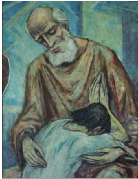
MÉCS LÁSZLÓ: A tékozló fiú hazatér (részlet)

A fejezet jelentős része az inkulturációról szól, arról, hogy az őslakos közösségekben meglévő értékeket számításba kell venni az evangelizálásnál. Mivel sokan szegénységben élnek, a „szociális és a spirituális dimenzió” karöltve kell hogy működjön az inkulturációban (75–76.), áll a buzdításban. A „papi szolgálat inkulturációjára” (85–90) a pápa szerint az egyháznak „bátor” választ kell adnia. „Nagyobb gyakorisággal kell biztosítani az eucharisztia megünneplését”, ehhez pedig fontos „pontosabban meghatározni, hogy mi a pap feladata”. A választ a papi rend szentségében találjuk meg, amely csak a papot hatalmazza föl a szentmise bemutatására. Akkor hát miként tudjuk „biztosítani a papi szol-