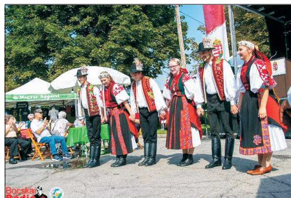
Kulturális programok is várták a résztvevőket

A Szent István Napi Magyar Fesztivál célja, hogy a magyarokat összehozza, valamint segítse megőrizni nemzet tudatukat az asszimilációval szemben.