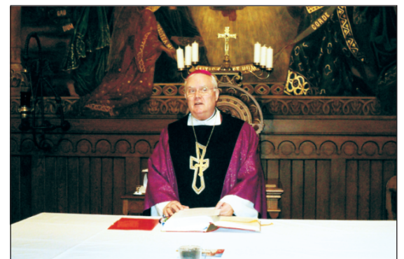
A program Cserháti püspök nevéhez fűződik