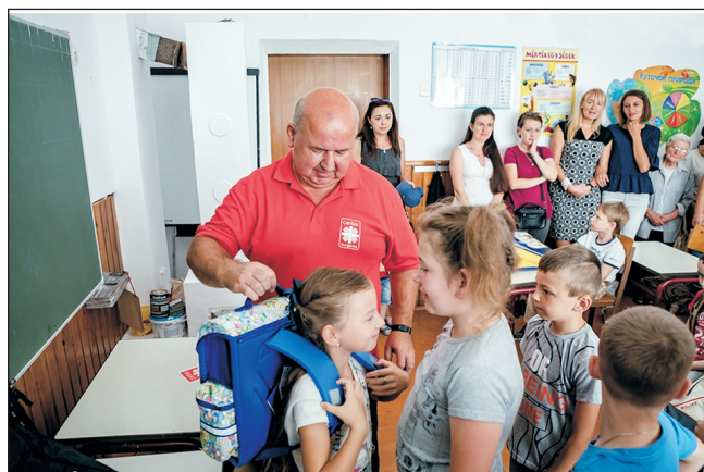
Tanszereket adományozott a Karitás

Több ezren vettek részt augusztus 26-án, hétfőn az úzvölgyi temetőben tartott megemlékező ünnepségen. Az eseményen a II. világháború úzvölgyi csatájának 75. évfordulójára emlékeztek, és a résztvevők lerótták kegyeletüket a temetőben nyugvó hősök emléké előtt. Az ünnepi szentmise főcelebránsa Tamás József gyulafehérvári segédpüspök volt, beszédét mondott Bőjte Csaba ferences szerzetes. □