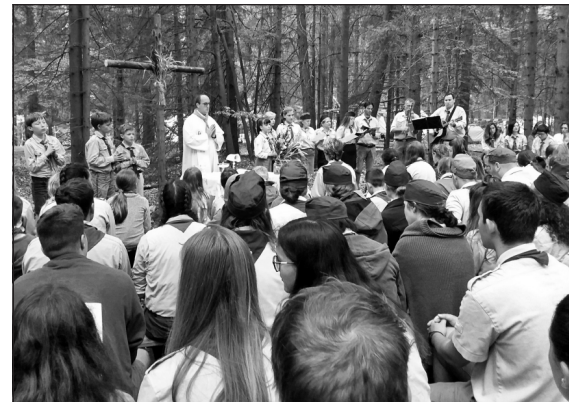
Több mint kétszázan vettek részt a szentmisén

Ausztriából, Magyarországról, Németországból, Svájcól, Belgiából, Hollandiából, Angliából, az Egyesült Államokból, de még Kínából is érkeztek cserkészek – összesen mintegy kétszázharmincan – július végén a Kastl bei Amberg-i tízhektáros Hárshegy Cserkészparkba. A három altáborra és négy táborra osztott cserkészcsoporthoz tagjai tíz napon át dolgoztak azon, hogy új örsvezetőket, kiscserkész-segéd-tiszteket képezzenek és ehhez a munkához a feltételeket megteremt-