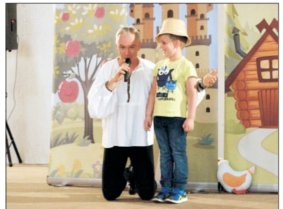
A legkisebbek is jól szórakoztak