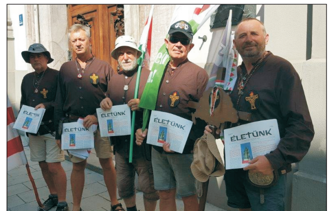
A zárándokok Münchenben