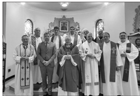
A magyar papi konferencia résztvevői

A külföldi magyarok lelkipásztori ellátásával megbízott esztergom-budapesti segédpüspök szentbeszédében az egyházi ünnep kapcsán a Szentháromság tükéről elmélkedett. A Szentháromság egy Isten személyein keresztül igyekezett megmutatni a hittitkot, amit nem tudunk kellőképpen felfogni a maga valóságában. Rámutatott: Az isteni személyek fo-