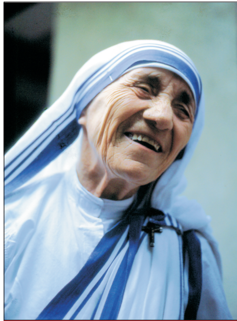
Kalkuttai Szent Teréz Ünnep: szeptember 5.

Az albán nemzetiségű Teréz anya 1910. augusztus 27-én született Agnes Gonxha Bojaxhiu néven Üszküb városában (ma Szkopje). Kilencéves volt, amikor édesapja meghalt.