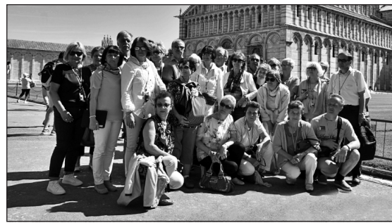
Itáliába látogattak a müncheni magyarok