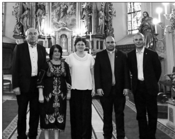
A szép vers és ének felemel és Istenhez vezet

létezése óta a legnagyobb titok, filozófusok és művészek örök ihletője. Eredetileg az Ölelj magadhoz címet viselő, de erre az alkalomra a Sík Sándor emléke előtti tisztelgés jeléül Hiszek címűre módosított lírai imakompozícióban sokféle istenes vers szerepel Ady antiimaverseitől kezdve Bartalis János panteista szemléletű lírájáig. Pilinszky, József Attila és mások a maguk módján mind Istent keresik, vagy próbálják tagadni, ami szintén az érintettségéről szól, hiszen csak azt tagadhatjuk, aminek a létezésében bizonyosak vagyunk. Ami nem létezik, azt ta-