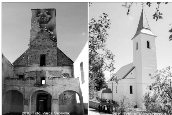
Széles összefogás révén épülhetett újjá

A Segélyalap húsz éve jött létre a Linzi Egyházmegye kelet-közép-európai