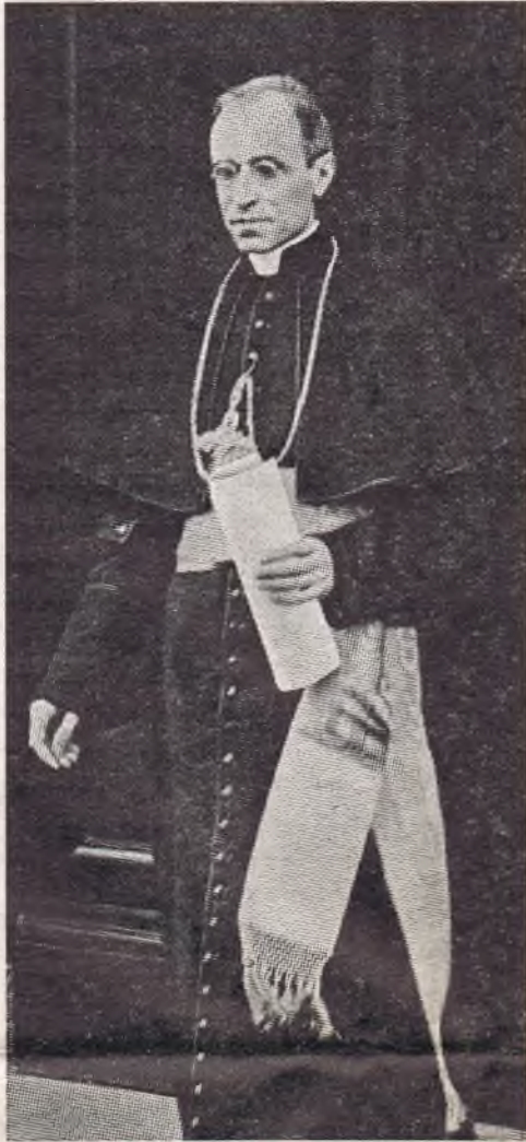
Pacelli bíboros-államtitkár, pápai legátus

Az előkészítő bizottság lelke, szíve, hajtómotorja, Mihalovics Zsigmond prelátus, az Országos Katolikus Akció központi igazgatója, örökre beírta nevét a magyar katolicizmus történetébe.