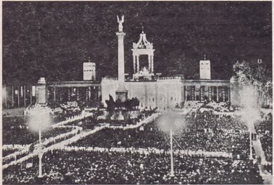
150.000 férfi éjjeli szentségimádása a Hősök-terén

mat. És utána, talán mint a legutolsó egyike, én is megáldoztam.