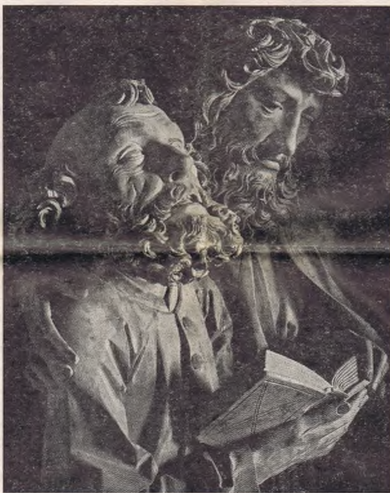
Tilman Riemenschneider: PÉTER és PÁL A Creglingeni faragott Mária-oltárról (1505 és 10 között)

Mikor — felsőbb parancsra — elhagyta az országot, az emigráció prófétája lett. Tanítása itt is egyszerű volt és igaz, mint minden igaz tanítás: kövessétek az Úr parancsait, maradjatok meg magyarnak, mert Istennek és a hazának szüksége lesz rátok. Nem állt rendelkezésére világot átfogó szervezet. Nem volt simán működő sajtója, nem volt hadserege, nem volt világi hatalma. Mégis: amerre járt, megmozgatta a magyar emigrációt, megmozgatta az egész világot. A személyes találkozás, hangjának vibrálása, aszkéta alakjának