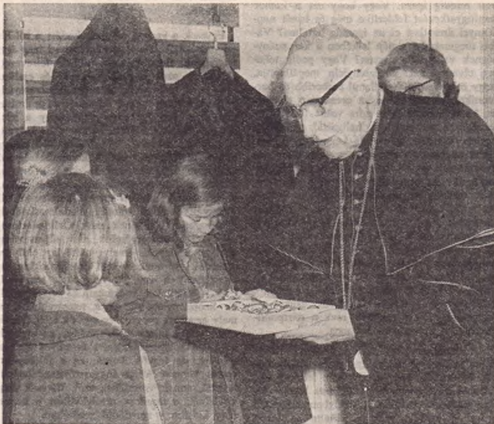
A bíboros-primás cukorkát ad a cserkészlányoknak