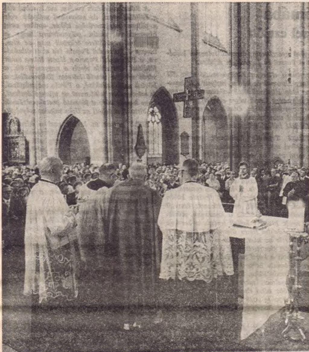
Mindszenty bíboros a szentmisét végzi a zsúfolásig megtelt templomban

szüke miatt e remek szónoklatokat egyik későbbi számunkban ismertetjük.) A kiválóan sikerült és magas színvonalú ünnepséghez Váci Gyula és Szörényi Éva számai nyújtották a művészi keretet. A szereplőknek Mindszenty József bíboros mondott hálás elismerő szavakkal köszönetet.