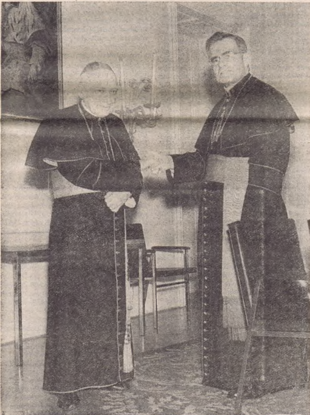
Mindszenty József magyar bíboros-primást németországi útjának első állomásán, Münchenben Döpfner kardinális meleg barátsággal fogadta.

Pünkösdkor a Szent István Milleneum tavaszi ünnepségeire Bambergban minden várakozást felülmúlóan három és fél ezer magyar gyűlt össze. Nemcsak az európai országokból érkeztek zarándokok, de sok hívó jött át az Észak Amerikai Egyesült Államokból és Kanadából is, hogy jelen lehessenek Mindszenty bíboros-primás szentmiséjén és meghallgathassák szentbeszédjét.