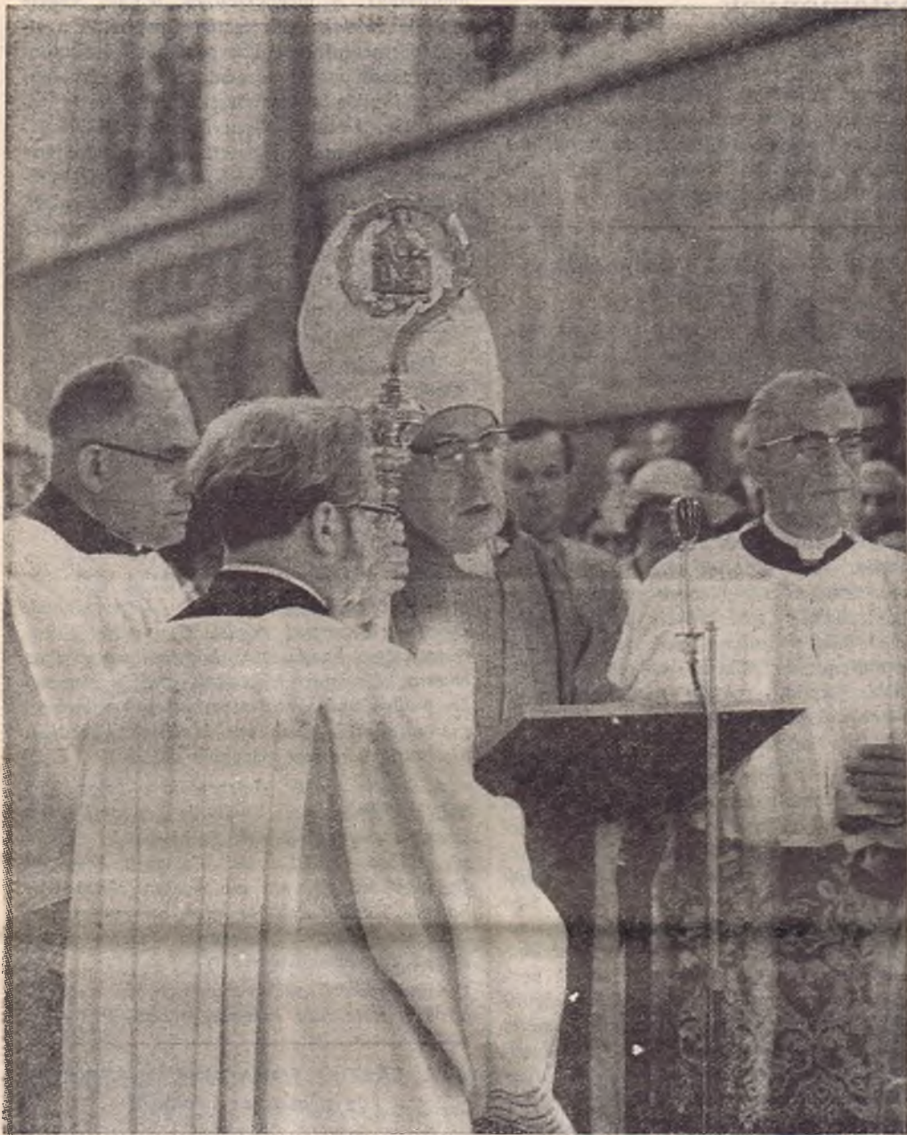
Mindszenty bíboros-prímás beszél a zarándokokhoz

sem. Hogy ilyen a világ, én nem mondom ellene, mert megfelel ez a meghatározás a világnak. Azonban hívő lélek nem lehet lelkesedő a mai korszakért és áramlatokért. Erkölcs terén különösen nem.