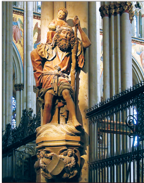
Szent Kristóf Ünnep: július 24.

A hagyomány szerint Kristóf a 3. század derekán Szamóban (Lükia) adta életét Krisztusért. Az útonjárók patrónusáról, akinek képét ma is sok autós és motoros magával hordja, a Legenda Aurea szerzője rajzolta a legszínesebb képet: