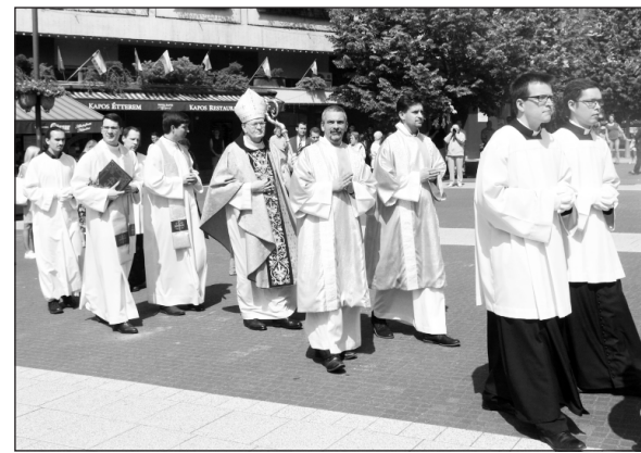
Jeles jubileumot ünnepelt Kaposvár

Ennek a misszióknak a célját szolgálják az új egyházmegyék éppúgy, mint a határok módosítása és a Veszprémi Egyházmegye érseki rangra emelése. A hajdani Veszprémi Egyházmegye déli részét a Balatontól a Drávaig önálló részegyház