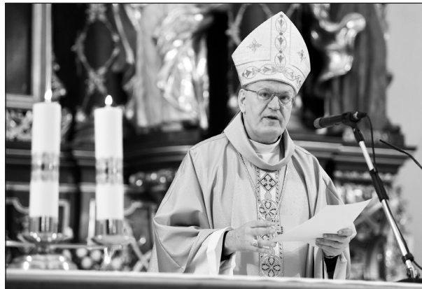
„A hit alapján épült újjá egyén és közösség élete”

Az isteni bölcsesség tehát úgy épít házat magának az emberek között, hogy minket magunkat akar felépíteni a szent