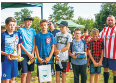
A győztes csapat tagjai