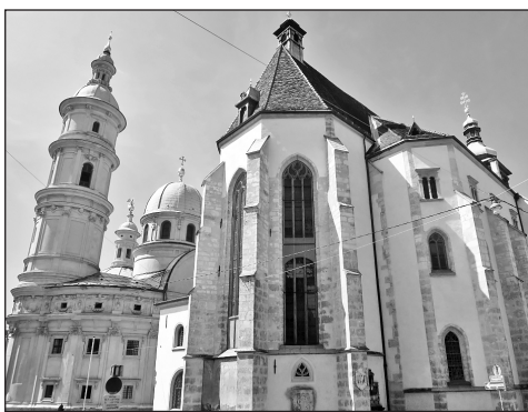
A grazi székesegyház

Míg a magyar állam- és egyházalapítás, amely Szent István nevéhez és korához kötődik, feltűnően gyorsan, néhány évtized alatt lezárult, ez a folyamat Ausztria, illetve Stájerország esetében évszázadokon át tartott. Ez vonatkozik a Graz-Seckau-i Egyházmegyénkire is, amely idén ünnepli nyolcszáz éves fennállását.