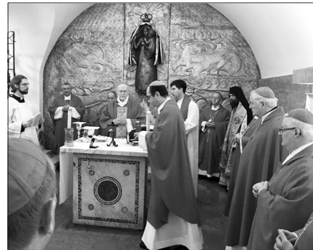
A Szent Péter-bazilika magyar kápolnájában