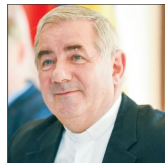
A kinevezett püspök