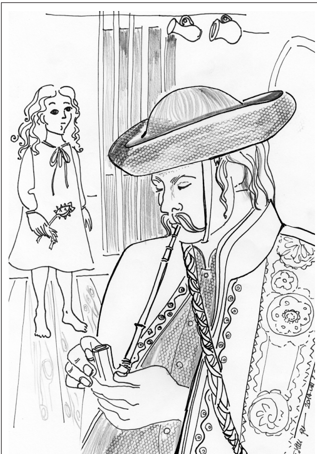
Tóth Gabriella rajza

– Hát minek vitték volna el, hisz ez nem lopott lovat?