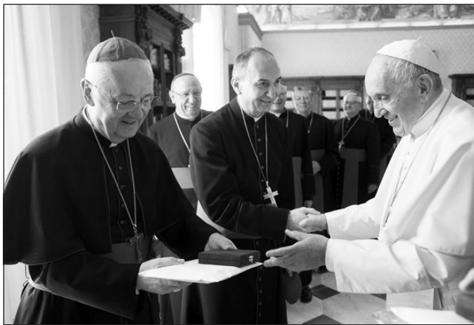
A magyar püspökök látogatása Ferenc pápánál

A Szentatya figyelmesen hallgatta felvetéseimet, és rögtön válaszolt kérdéseimre. Már beszédem közben észre lehetett venni tekintetéből, hogy megértéssel és örömmel fogadta kérdéseimet. Szinte az volt a benyomásom, hogy saját migráns múltjára és családjára is gondolt, ami később ki is derült, amikor családja leszármazottjairól és