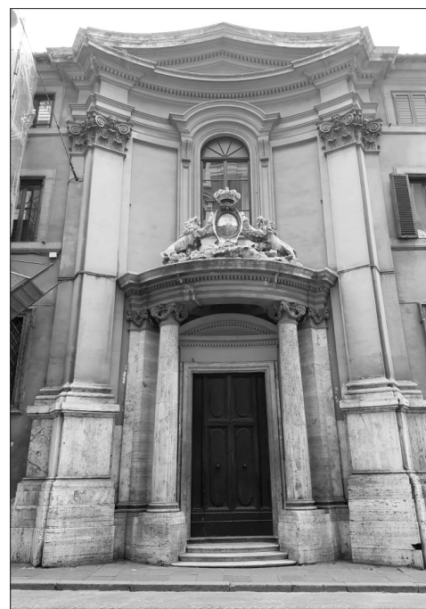
A Remete Szent Pál-templom