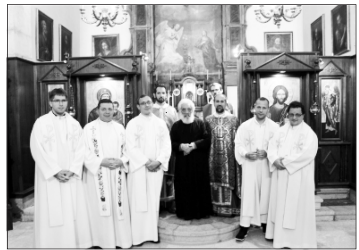
A dél-olasz szigetre látogattak a PMI papjai

Szicília mindig kultúrák találkozási pontja volt, és sok szállal kötődik a keleti kultúrához is. Az ókorban Magna Graecia (Nagy-Görögország) része volt, majd a Római Birodalom kettészakadását kö-