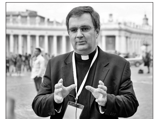
Duarte de Cunha prelátus

Portugáliában 2007-ben legalizálták az abortuszt. Elemzők szerint az euta-