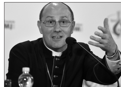
Wojciech Polak lengyel primás

Ludwig Schick bambergi érsek, a német püspöki konferencia egyházi kap-