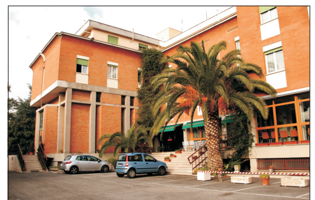
A Szent István Ház Rómában