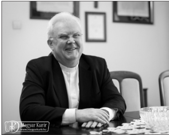
„Tudom, honnan indultam”

ra, hogy azóta és a nagy távolságok ellenére is minden évben találkozunk, és amikor csak lehetett, magam is részt vettem ezeken az összejöveteleken, bár nagyon messzire szakadtam tőlük. A 46. szentelési évfordulómat most Esztergomban ünnepeljük meg. Büszkén mondhatom, hogy osztálytársaim mind megállták a helyüket, igazi lelkipásztorok. Egyre kevesebben vagyunk persze, de áldozatok árán is ápoljuk a