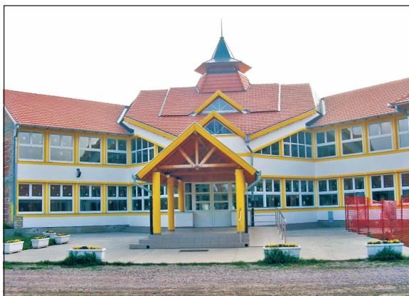
A megújult tóthfalui diákothon

Soltész Miklós, az Emberi Erőforrások Minisztériumának egyházi, nemzetiségi és civil kapcsolatokért felelős államtitkára jelenlétében adták át március 2-án, csütörtökön a vajdasági Tóthfaluban a helyi diákothon informatikatermét, amely a magyar állam támogatásával újulhatott meg. A délvidéki tóthfalui Egyházi Oktató Nevelő Központ diákothonának informatikatermébe tizenegy asztali számítógépet vásároltak, miután a magyar kormány 2,9 millió forint értékben támogatást biztosított erre a célra. Az Emberi Erőforrások Minisztériuma eddig összesen 12 millió forintot adott a tóthfalui Munkás Szent József Római Katolikus Plébánia részére a helyi egyházi diákothon fejlesztési céljaira. A tóthfalui diákothont 2002-ben hozták létre a magyar kormány támogatásával. Az intézmény 65-70 lakó számára biztosít szállást és étkezést. □