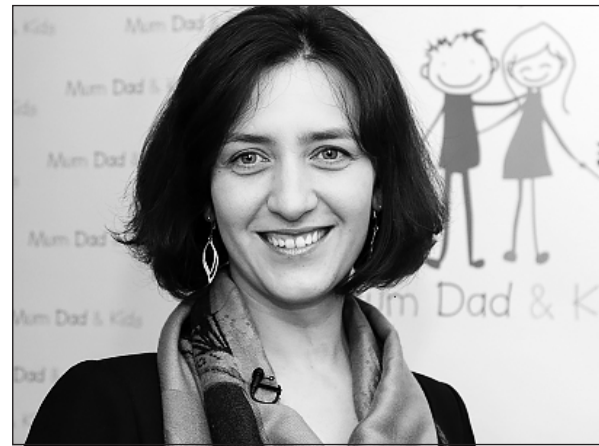
A kezdeményezés koordinátora

– Magyarországon szerencsések vagyunk, mert mind az emberek, mind a jelenlegi döntéshozók látják a családi kapcsolatok szerepét a társadalom számára. Hazánkra úgy tekintenek sokan Európában, mint arra az országra, amely magában hordozza a kulcsot Európa jövőjéhez: az értékrendünkkel, a házasságról és családról alkotott képünkkel jövőt teremtünk a következő generációk számára. A legtöbb európai