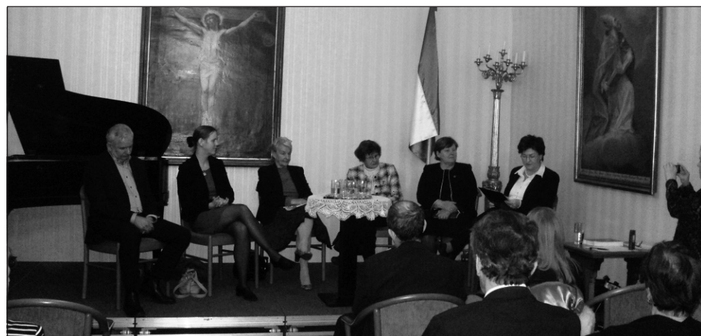
A pódiumbeszélgetésen részt vett Kiss-Rigó László szeged-csanádi püspök is