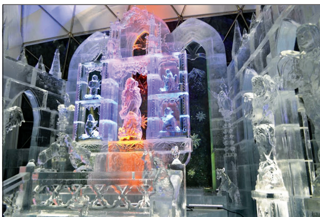
Az ótátrafüredi ideiglenes templom 90 tonna tömegű és 720 jégtömb felhasználásával készült

Immár negyedik éve alkották meg a jég-szentélyt a szlovákiai Ótátrafüred feletti egyik csúcson az erre alkalmas téli időszakban. Tavaly után idén ismét a fel-