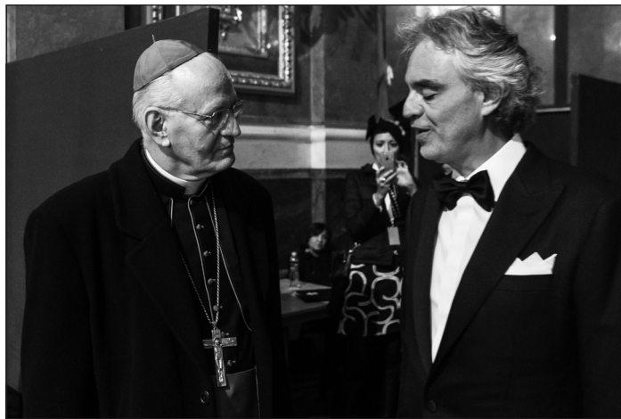
Erdő Péter bíboros Andrea Bocellivel

A házasság maga szentség, kegyelmi erőforrás, nem csak megkötésének pillanatában, hanem fennállásának egész ideje alatt. Ez azt jelenti, hogy a család is, amely a házasságra épül, a kegyelem működésének sajátos színtere. De Jézus minden házasságot felbonthatatlannak tanít. Nemcsak a tanítványok körében kötött házasságokat. Azt mondja, a Teremtő szándékára hivatkozva, hogy: „Kezdetben férfinak és nőnek teremtette” az embert. „Ezért a férfi elhagyja atyját és anyját, és feleségéhez ragaszkodik,