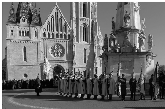
Hagyományörző bemutató a Szentháromság téren

A háború befejezését követően „Károly nem fogadta el azt az ajánlatot, hogy mondjon le a trónról és ennek árán mentse meg családi vagyonát. »Sohasem fogok a pénz kedvéért lemondani azokról a jogokról, amelyeket