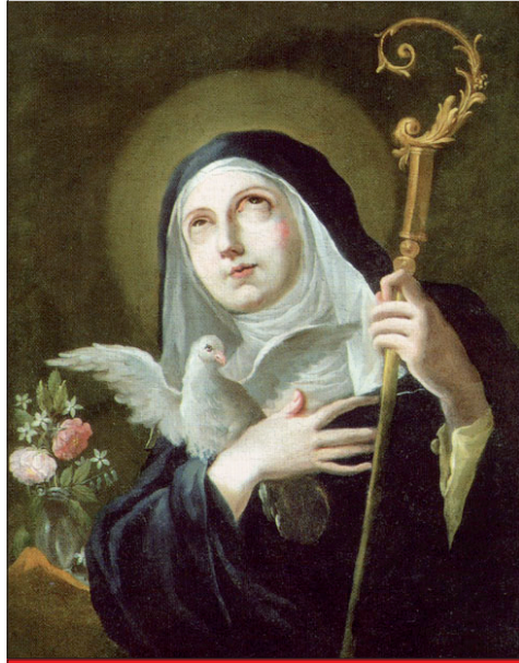
Szent Skolasztika Ünnepe: február 10.

A betegek világnapja jó alkalom arra, hogy megújult lendülettel járjunk hozzá az élet, az egészség és a környezet tisztességének kultúrájához. Ahhoz, hogy küzdjünk a személyek integritásának és méltóságának tiszteletben tartásáért, a bioetikai kérdésekben helyes álláspontot képviselve, a leggyengébbek és a környezet védelmében. A pápa imáiról és bátortásáról biztosítja az orvosokat, az ápolókat, az önkénteseket, a női és férfi szervezeteket, akik a betegeket és a gyengékedőket szolgálják. Hasonlóképpen támogatja az egyházi és polgári intézményeket és a családokat, akik szeretettel gondozzák beteg tagjaikat. Legyenek mindig Isten szeretetének örömteli jelei. Kövessék Istenes Szent János és Lellisi Szent Kamill, az kórházak és egészségügyi dolgozók védőszentjeinek példáját, illetve Szent Kalkuttai Teréz anyát, Isten gyengédségének misszionáriusát. □