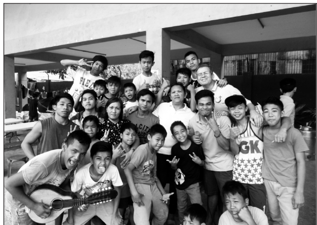
A verbiták által támogatott cebui gyermekotthonban