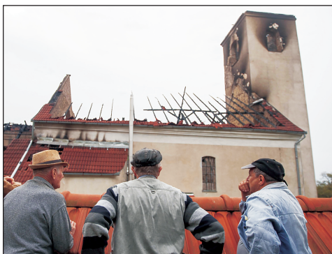
A villámcsapás után

Villámcsapás következtében szeptember 19-ére, hétfőre virradóra leégett a székelyföldi Atyha római katolikus temploma. A néhány évvel ezelőtt teljesen felújított templomépületnek volt vilámlámpájára, de a légköri elektromos kisülés olyan rendkívüli erejű volt, hogy a