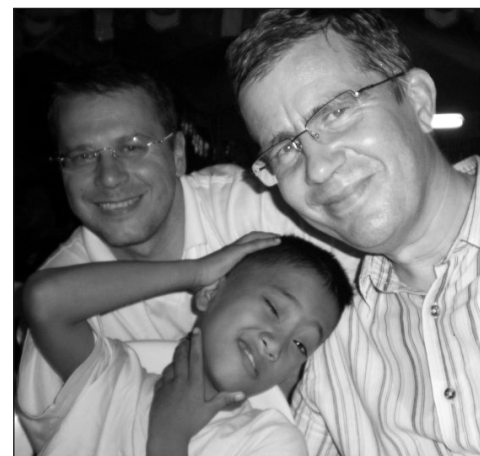
Kilenc éve szolgál a Fülöp-szigeteken

Így érkeztem kilenc éve a Fülöp-szigetekre. A verbita misszió egyetemén (amelynek 25.000 hallgatója és 1.600 oktatója van, és több mint 400 éve, 1595-ben alapították) dolgozom. A szerzetes-testvér-jelöltek prefektusa is én vagyok. Háromévenként jöhetek haza szabadságra, ilyenkor találkozom a hazai magyarsággal. Nagy örömmre szolgált, hogy májusban a Pázmáneum, a bécsi magyar szeminárium ottani, nyugatra szakadt hazánkfiaiának szóló szombat esti szentmiséjén is részt vehettem, melyet Pintér Gábor, kinevezett fehéroroszországi apostoli nuncius celebrált. Két és fél hónapos európai szabadságom lejáratá után visszatérek a Fülöp-szigetekre. Mint mindig,