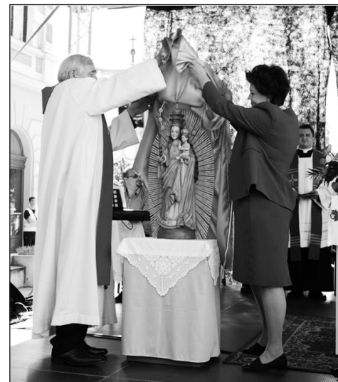
A Szűzanya-szobor másolata