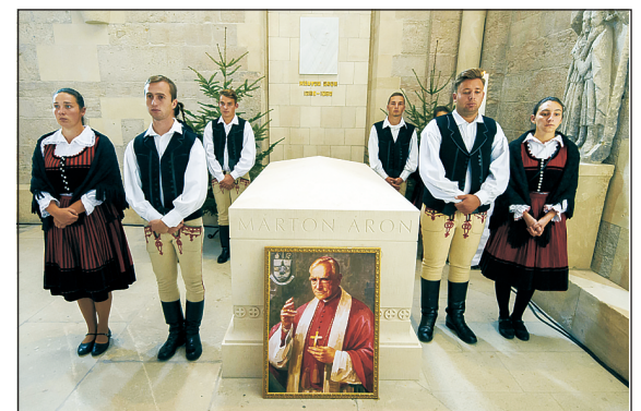
Márton Áron püspök kőszarkofágja