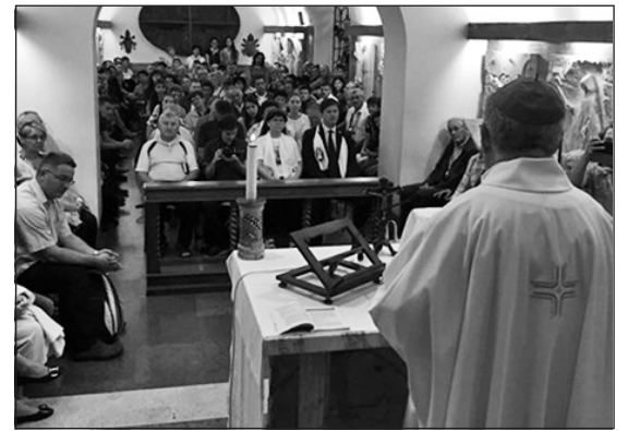
A Magyarok Nagyasszonya-kápolnában