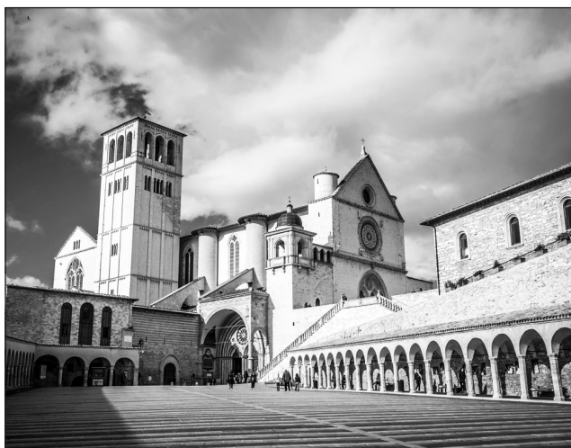
Assisiben gyűltek össze a világ vallási vezetői