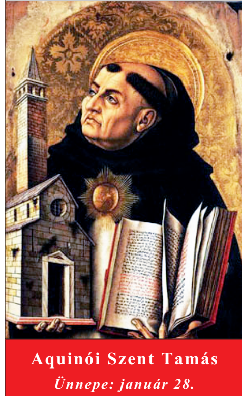
Aquinói Szent Tamás Ünnepe: január 28.

Tamás a nápolyi Aquinói grófok nemzetségéből származott. Már öt éves korában a közeli montecassinói bencés kolostorba adták nevelésre. A kor fölfogása szerint családja és háza fényét kellett volna növelnie. A nemes ifjúban azonban nem ilyesmi forgott a fejében.