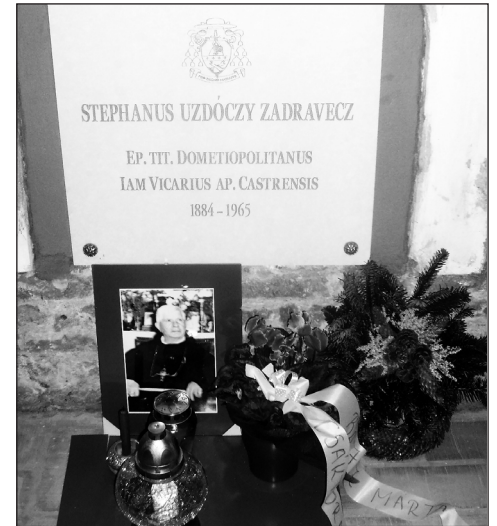
A püspök síremléke Esztergomban