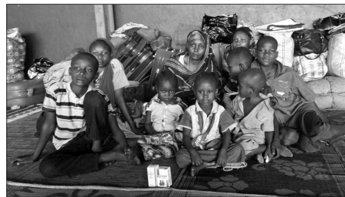
A Szentatya a bangui menekülttáborban is felkereste

Ezért találkozott az evangélikus és a muzulmán közösséggel, osztozva velük az imádságban és a béke iránti elkötelezettségben. A papokkal és a szerzetesekkel, de a fiatalokkal is együtt élte át annak örömét, hogy az Úr feltámadt és velünk van a csónakban, és Ő az, aki átvezet minket a túlsó partra. Végül pedig az utolsó szentmisét említette a pápa Közép-Afrikában, a bangui stadionban András apostol ünnepén, ahol újból elkötelezték magukat Jézus követésére, aki a mi reményünk, a mi békénk, az isteni irgalmasság arca. Ez az utolsó szentmise csodálatos volt: az egész stadion zsúfolásig telt fiatalokkal. A Közép-afrikai Köztársaság lakosságának több mint a fele kiskorú, 18 év alatti: ez