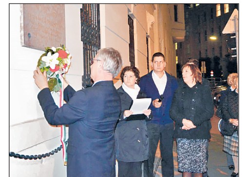
Az államtitkár helyezte el a koszorút