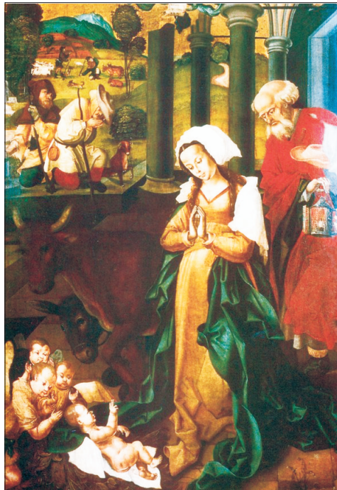
M. S. Mester: Jézus születése

Mi, a szinódusi atyák, azt kérjük tőletek, hogy folytassuk együtt az utat a következő szinódusig. Előttetek jár Jézus, Mária és József családjának a jelenléte, az ő szerény otthonukban. (...) □