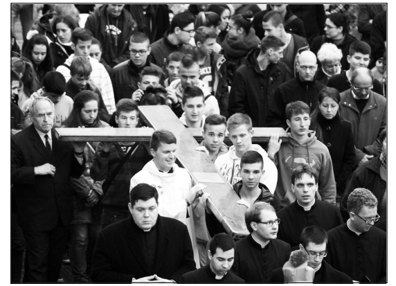
A kereszt Veszprémben

A győri Szent Imre-templomban november 9-én Pápai Lajos püspök beszédében bátorította a fiatalokat: merjenek