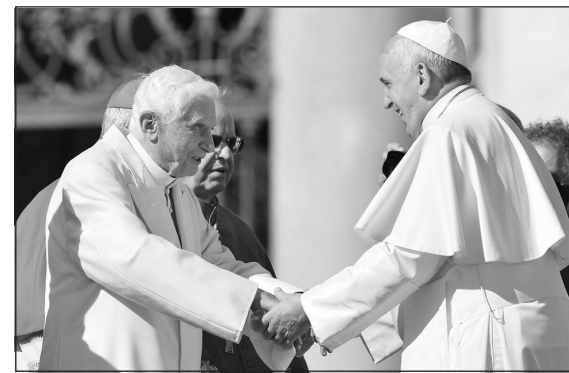
Benedek pápa is ott volt az idősek napján

Vannak néha olyan fiatal generációk, amelyek összetett történelmi és kulturális okokból erőteljesebben megélik annak a szükségét, hogy önállókká váljanak szüleiktől, mintegy „megszabadulva” az előző nemzedék örökségétől. Egyfajta serdülőkori lázadás ez. De ha nem jön létre a nemzedékek között egy új, termékeny egyensúly, akkor ez a nép elszegényedéséhez vezet, és a szabadság, amely a társadalmat uralja, hamis szabadság, amely csaknem mindig önkényuralommá alakul át.