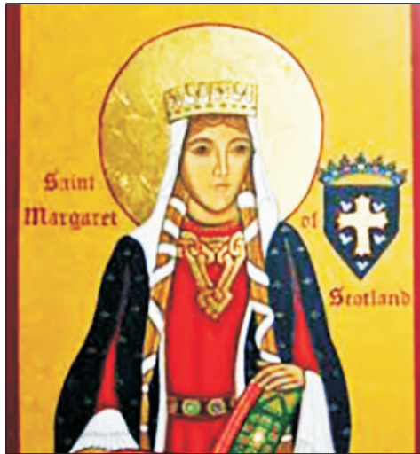
Skóciai Szt. Margit (1047–1093) Emléknapja: november 16.

Margit sorsát, születésétől haláláig, a világtörténelem jobban meghatározta, mint a többi fejedelmi családból született gyermekét. Ezt életrajzírója, Durmferline-i Theoderich szerzetes is érezte, mert a szent életrajzában – amelyet Margit leányának, Matildnak, Anglia királynőjének írt – a szokásosnál nagyobb helyet szentelt a történelmi eseményeknek.