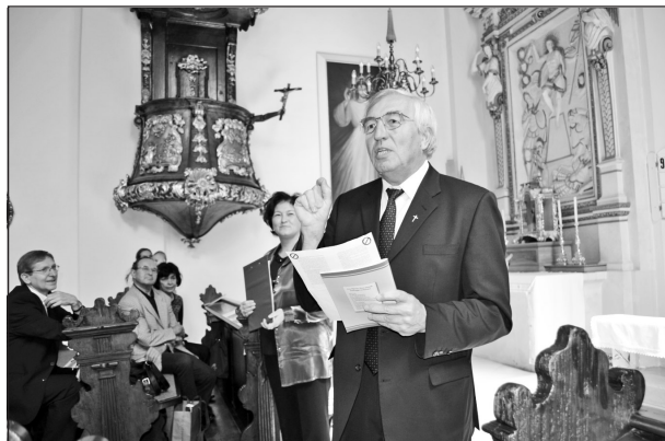
„Szükségünk van ilyen példaképekre”