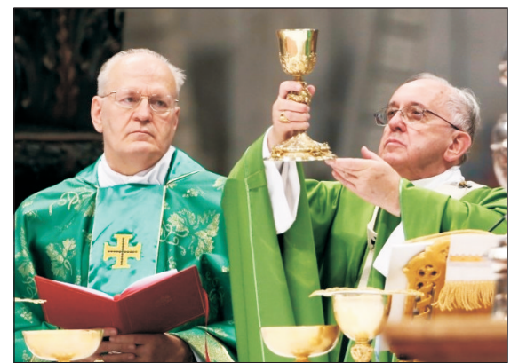
A Szentatyával koncelebráltak a szinódusi atyák

„Gyújts világosságot a családban” – ez volt a témája annak az imavirrasztásnak, amelyre mintegy negyvenezer hívó