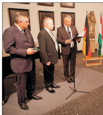
Hitet és erőt kell merítenünk