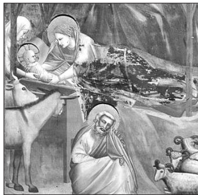
Giotto: Jézus születése (részlet)

Budapest, 2012. december 2., advent első vasárnapján