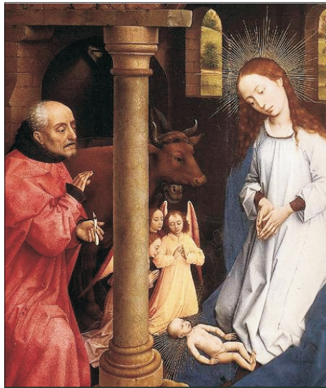
Roger van der Weyen: Jézus születése

BOLDOG KARÁCSONYT KÍVÁN OLVASÓINK AZ ÉLETÜNK!