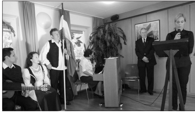
... a Katolikus Misszió épületében

Ezúttal különösen gazdag volt az ünnepi program, amelyet a müncheni magyar főkonzulátus kulturális attaséja, Chiovini